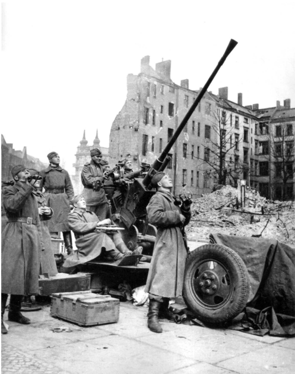
37-мм автоматическая зенитная пушка на позиции в Берлине. Активность вражеской авиации заставляла зенитчиков быть начеку.