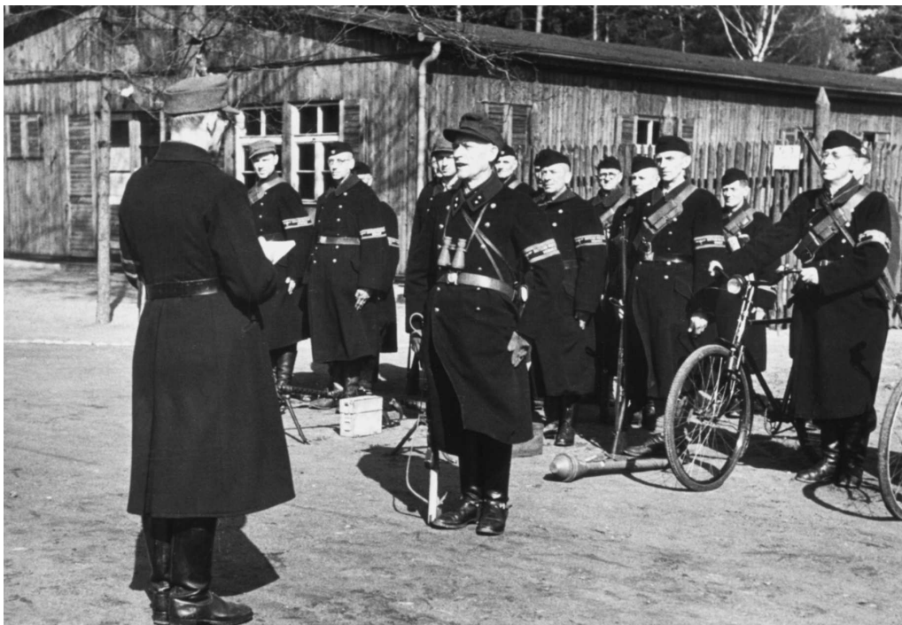
Берлинский фольштурм. Подразделение на снимке неплохо вооружено и в единообразной униформе.

чтобы оборонять каждое здание, как это имело место в других городах, поэтому противник оборонял, главным образом, группы кварталов, а внутри их отдельные здания и объекты, являющиеся ключевой позицией района или целой административный район города – этому способствовало большое количество каналов, изолирующих отдельные районы города» 1 .