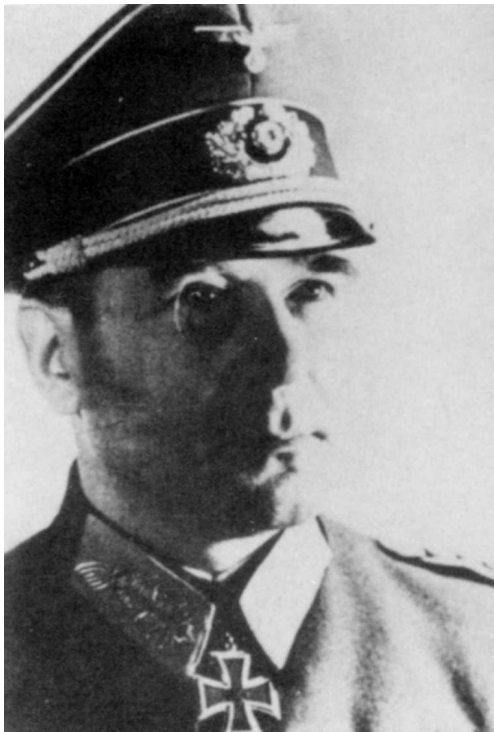
Генерал пехоты Ханс Кребс, последний начальник Генерального штаба германской армии.

41 гг. по проекту Шпеера и по своему основному назначению они были убежищами для населения в период налетов. Считалось, что вероятность прямого попадания бомбы в башню ниже, чем в подземное убежище. Каждая башня по плану вмещала 18 тыс. человек. В Берлине было построено три таких гигантских сооружения. Это были Flaktuerm I в районе Зоопарка, Flaktuerm II во Фридрихсхайне (на востоке города) и Flaktuerm III в Гумбольтхайне (на севере города).