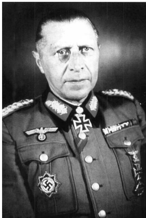
Командир LVI танкового корпуса генерал артиллерии Гельмут Вейдлинг.

Готовил Берлин к обороне с января 1945 г. штаб Швонного округа. 6 марта 1945 г. комендантом Берлина был назначен генерал-лейтенант Хельмут Рейман. Это был достаточно опытный военачальник. Рейман участвовал в войне с СССР с июня 1941 г., в 1944 г. командовал 11-й пехотной дивизией, воевавшей в районе Нарвы и Риги. Был награжден Рыцарским крестом и дубовыми листьями. Задачу Реймана нельзя было назвать простой: основные усилия командования группы армий «Висла» были сосредоточены на укреплении обороны на Одере. В распоряжении коменданта Берлина были только 92 батальона фольксштурма и отдельные части. Вообще сражение за Берлин характеризуется участием в нем целого «зоопарка» различных немецких частей. В частности