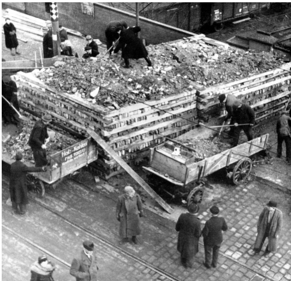
Строительство типичной для Германии баррикады поперек улицы. Стенки такого сооружения образовывали деревянные брусья или рельсы, а заполнялось оно камнями и землей. Подобные баррикады не преодолевались танками и выдерживали попадание снарядов до 152-мм калибра.

Бомбардировки союзников привели к появлению в городе таких своеобразных сооружений как башни ПВО (Flakturm). Это были бетонные башни высотой около 40 м, на крыше которых оборудовались установки зенитных орудий до 128-мм калибра. Также башни оснащались 20-мм и 37-мм автоматическими зенитными пушками. Башни ПВО строились в 1940–