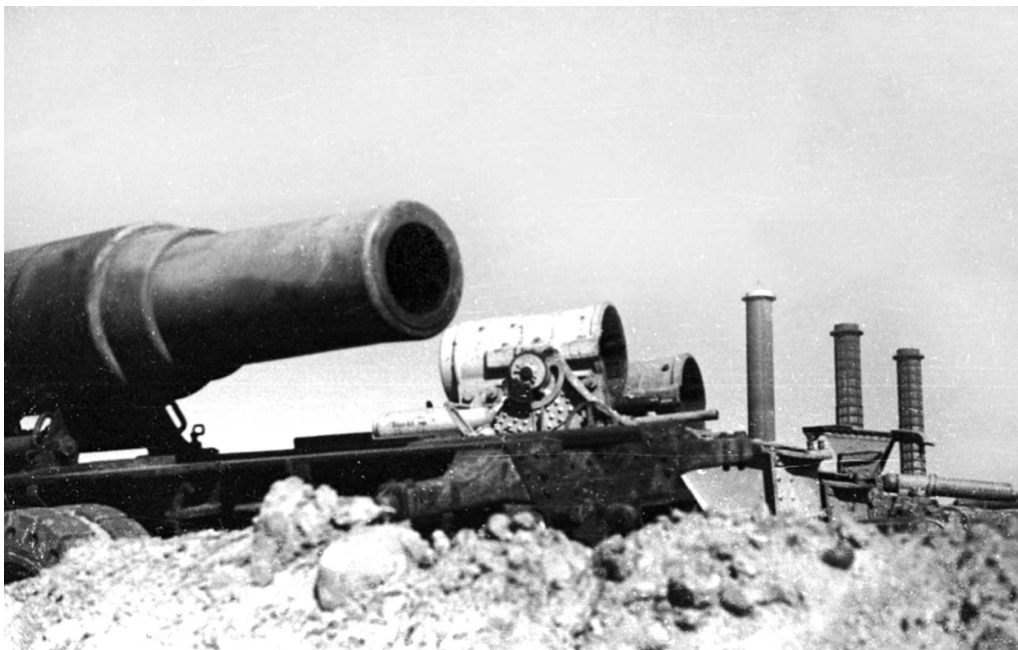
Брошенные в Берлине 305-мм мортиры «Шкода» чешского производства. Они прошли с вермахтом от первого дня войны до последнего.

поначалу была сосредоточена в секторах А и В на востоке Берлина, но к утру 25 апреля она ввиду изменения обстановки была переведена в сектор D.