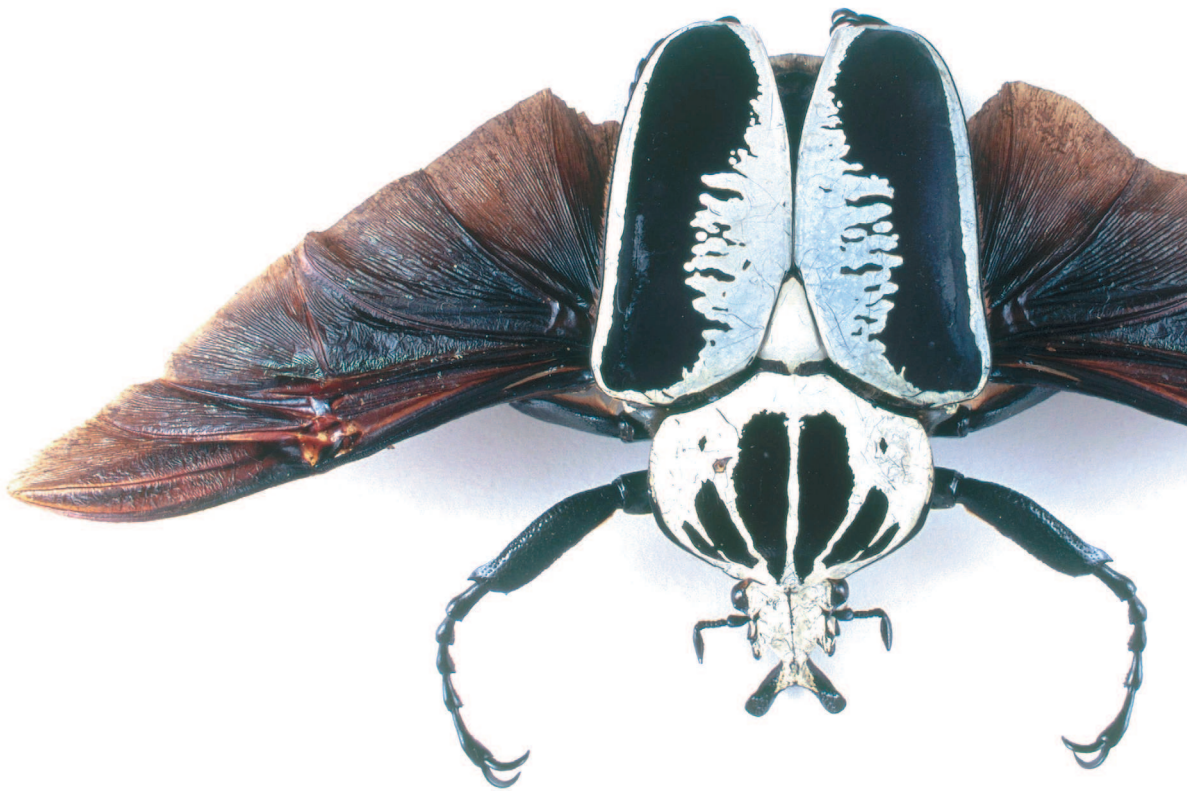
Королевский жук-голиаф, стр. 44