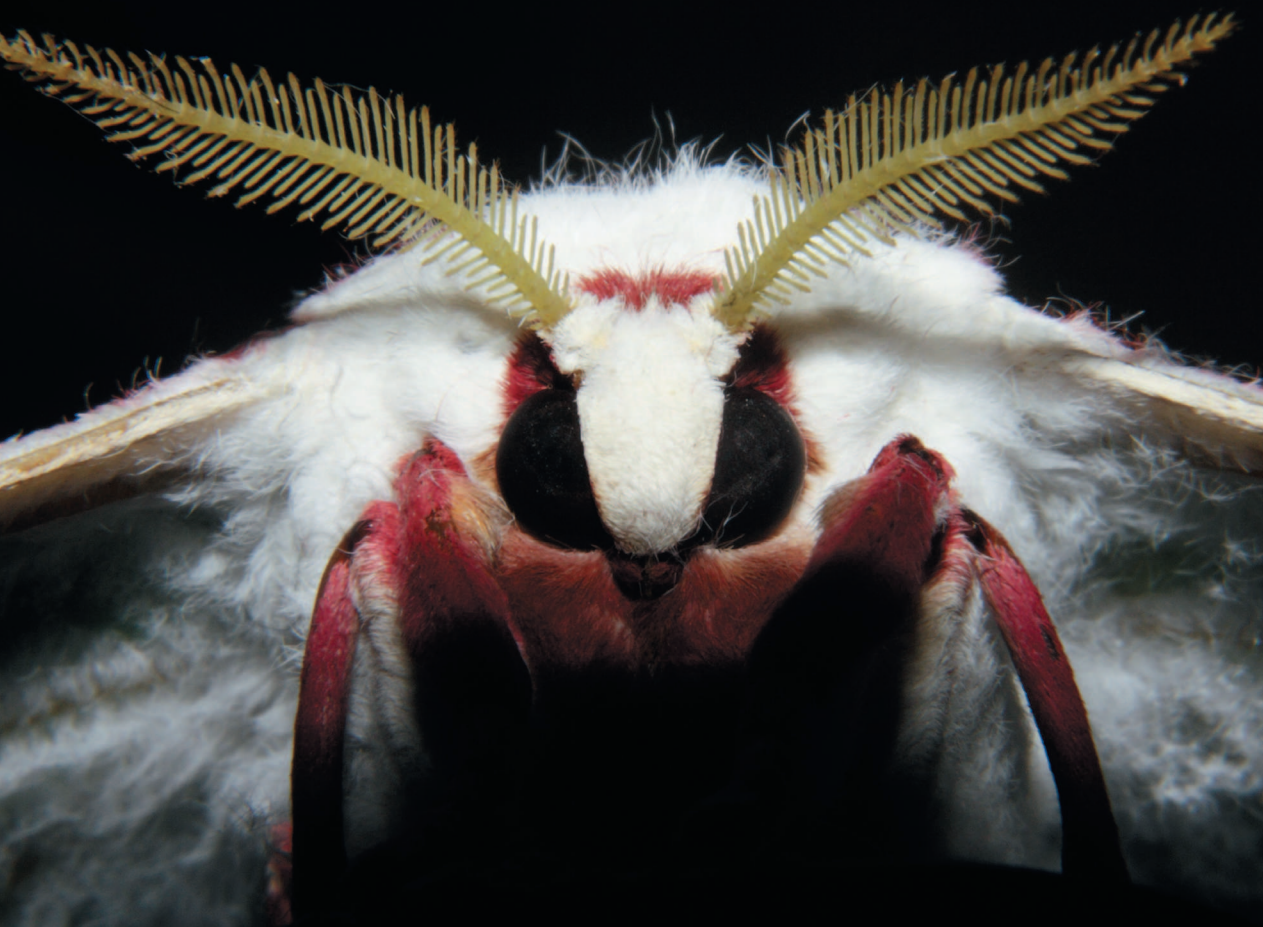
Лунная моль, стр. 52