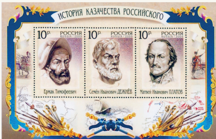
▲ Почтовый блок «История казачества России»

Два года спустя, весной 1645 года, Стадухин и Зырян надумали ехать в Якутск, чтобы отвезти собранный ясак и отчитаться перед начальством. С собой они забрали половину казаков. В остроге остались 13 человек, включая Дежнёва. Едва слух об отъезде части казаков разнесся по округе, более 500 юкагиров осадили острог. Сдержать их натиск «огненным боем» не удалось. Туземцы ворвались за частокол, началась рукопашная схватка. Спротивлялись казаки отчаянно. Они все были изранены, Дежнёв получил железную стрелу в голову, но продолжал сражаться. В конце концов казакам удалось заколоть предводителя юкагиров. Гибель вождя