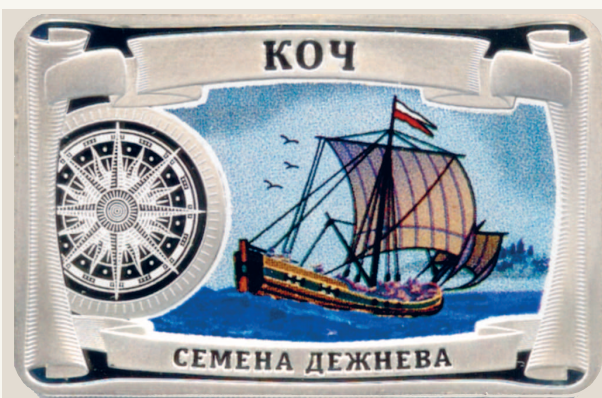
▲ Серебряный жетон с изображением коча Семёна Дежнёва. Из серии «Самые красивые корабли мира»