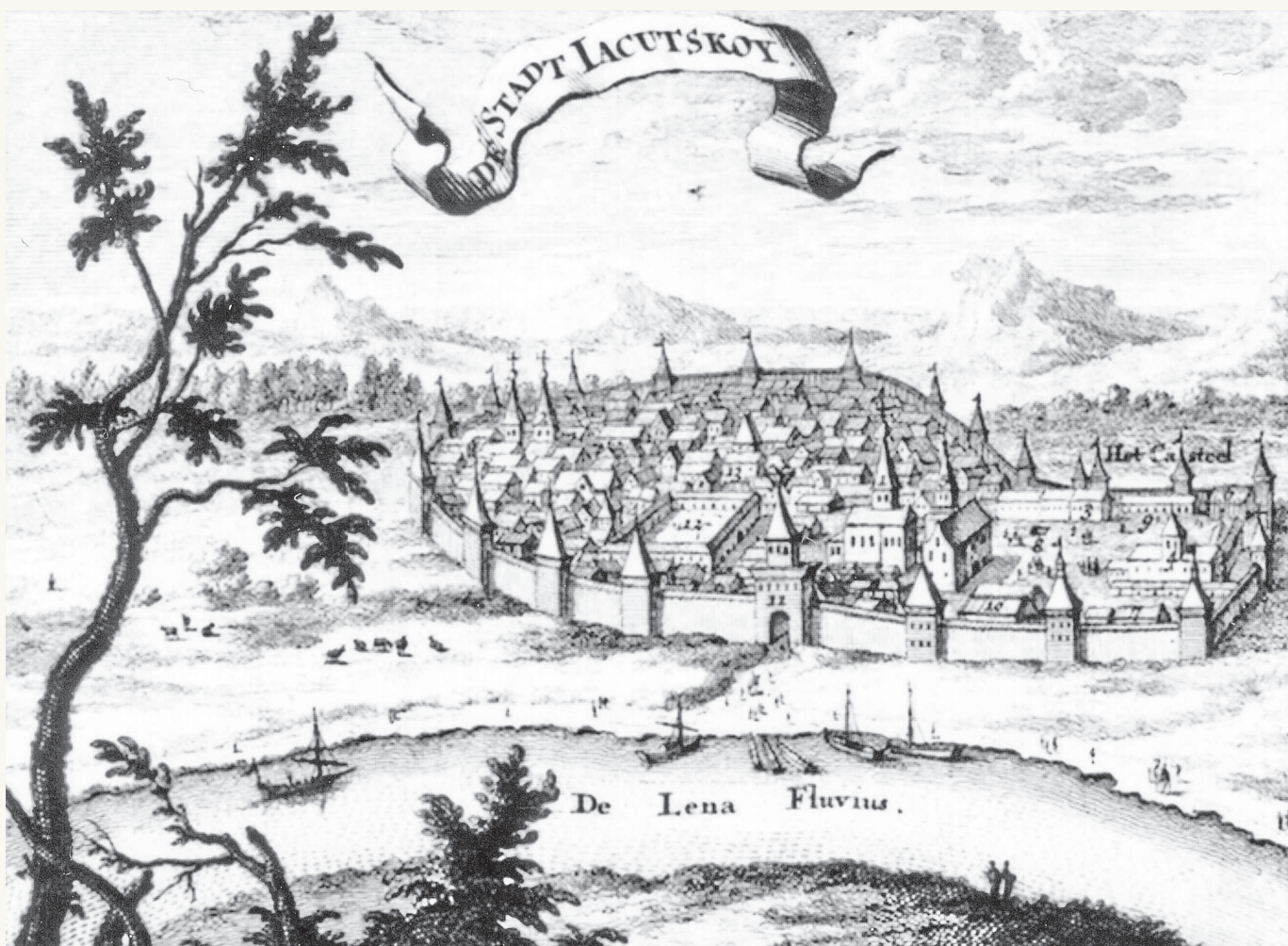
▲ Якутск – гравюра голландского картографа Николаса Витсена. Конец XVII в.