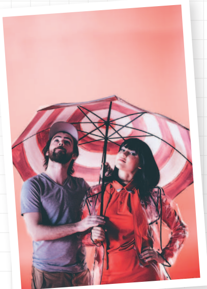
На съемках клипа с Natoo в 2018-м