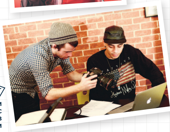
Съемка в студии Bagel с мистером V в 2013-м