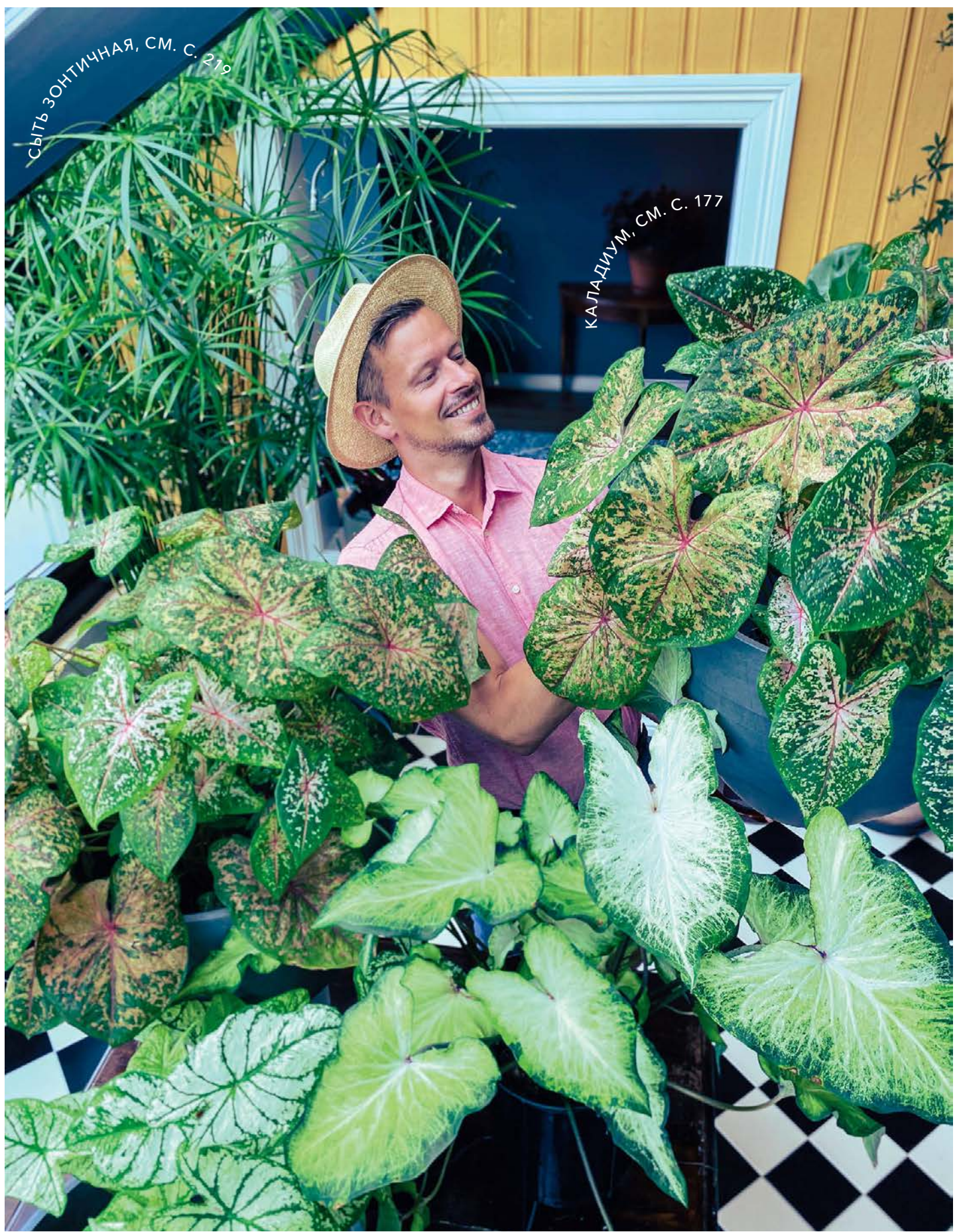
СЫТЬ ЗОНТИЧНАЯ, СМ. С. 219