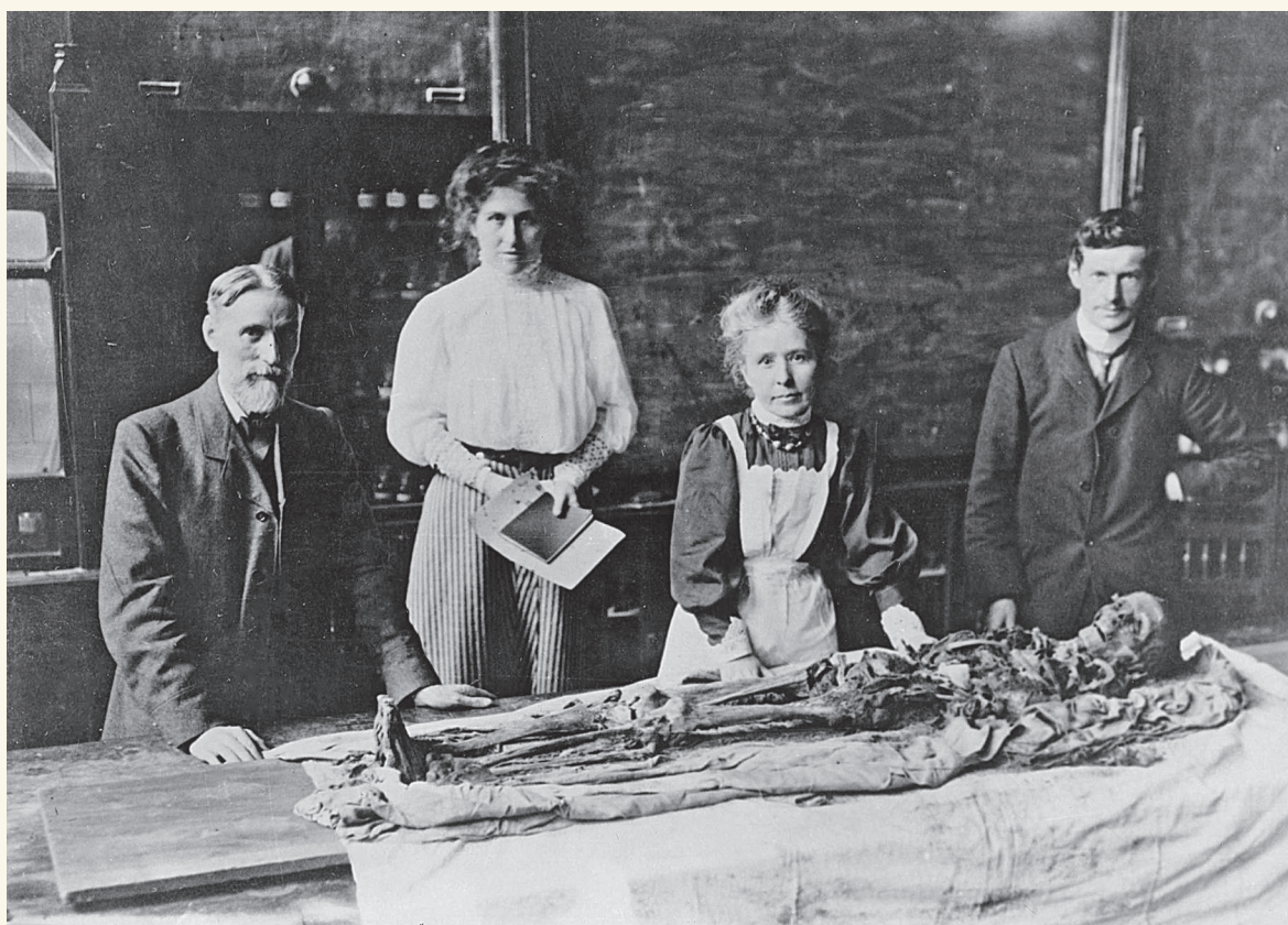
Маргарет Мюррей с учеными