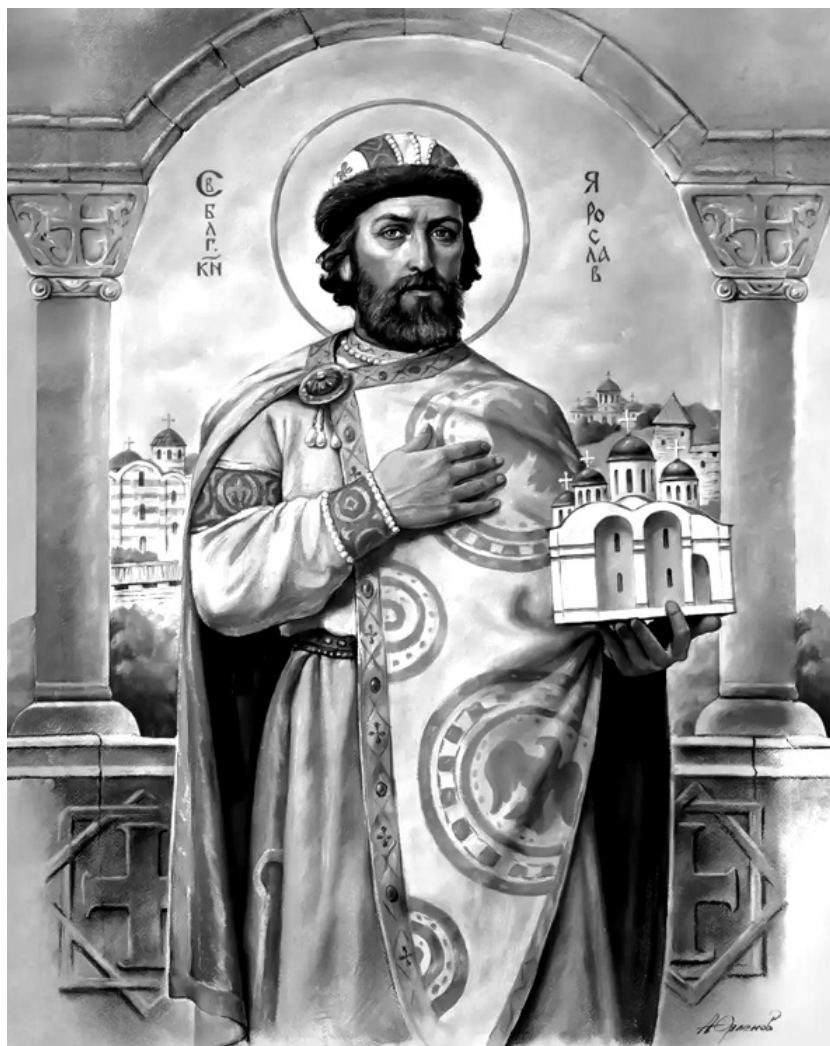
Князь Ярослав Мудрый