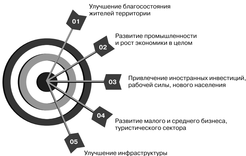
Рис. 1.5. Основные цели маркетинга территории