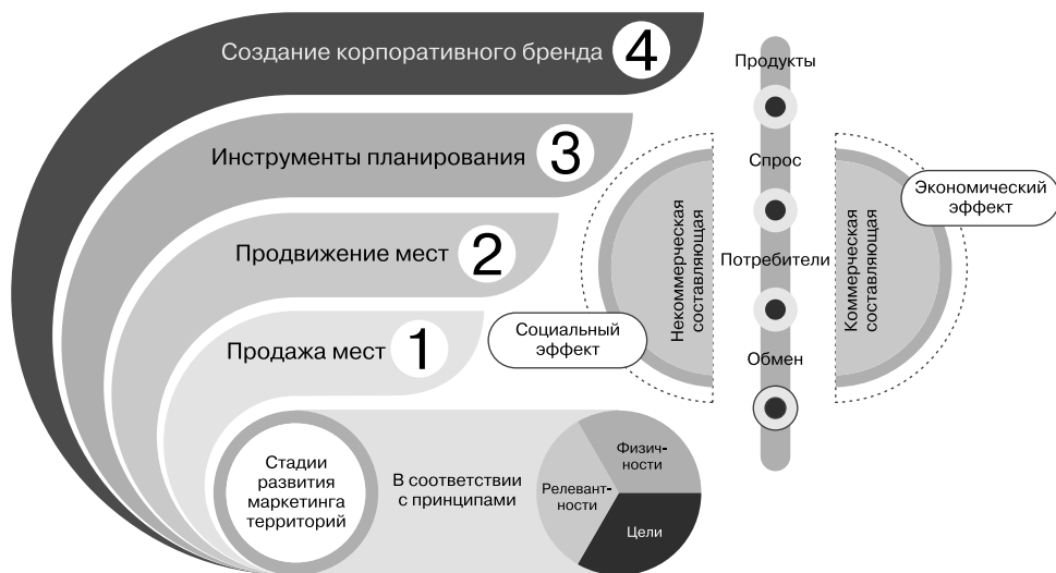
Рис. 1.6. Стадии развития, принципы и основные составляющие маркетинга территорий

Территория как объект маркетинга предопределяет особые подходы к продвижению. Маркетинг территорий отличается от традиционного маркетинга мультипотребностным характером, поскольку территория не потребляется в прямом смысле слова, а предполагает более сложную и многоаспектную систему потребления.