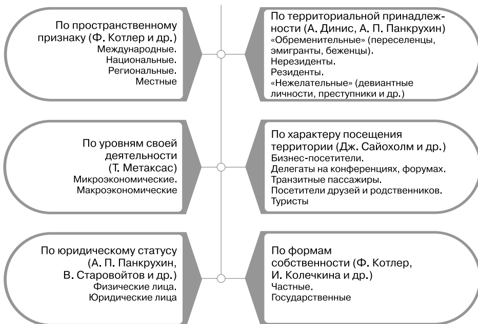
Рис. 1.4. Целевые рынки маркетинга территорий