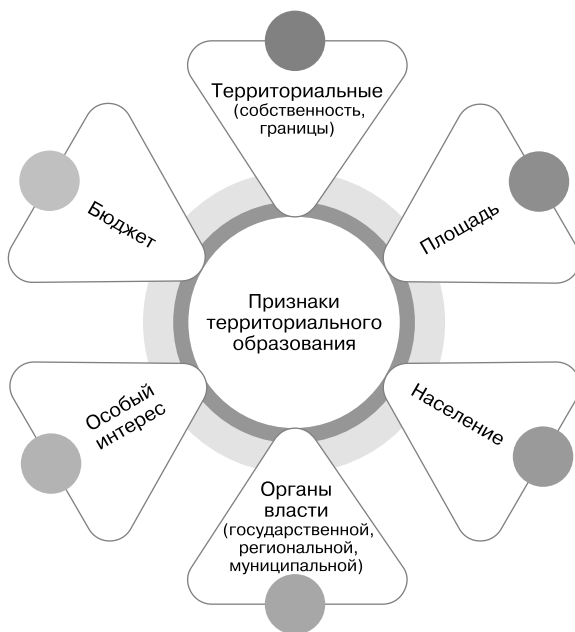
Рис. 1.1. Схема признаков территориального образования

Территориальное образование характеризуется рядом признаков, таких как территориальные границы, территориальная собственность, площадь, органы государственной, региональной или муниципальной власти, бюджет и население, а также специфическим целостным территориальным интересом как диалектической совокупностью интересов всех субъектов, действующих на данной территории (рис. 1.1).