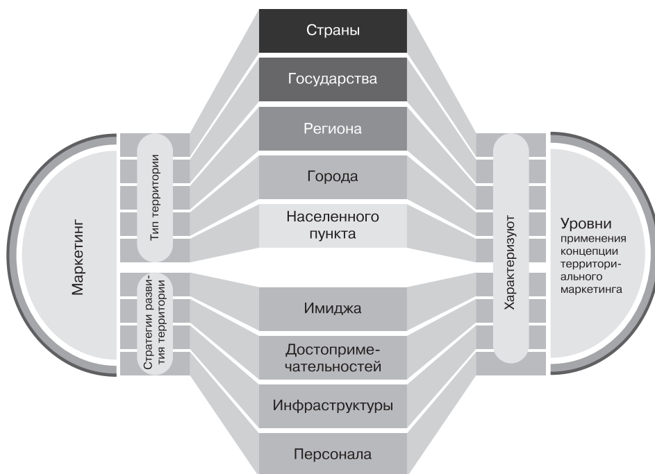
Рис. 1.3. Виды территориального маркетинга

При этом все они базируются на единых принципах маркетингового развития территории и различаются спецификой, свойственной данному масштабу. Парадокс заключается в соотношении масштаба, статуса территории и числа ее жителей. Эти сведения обязательно нужно учитывать при создании бренда территории