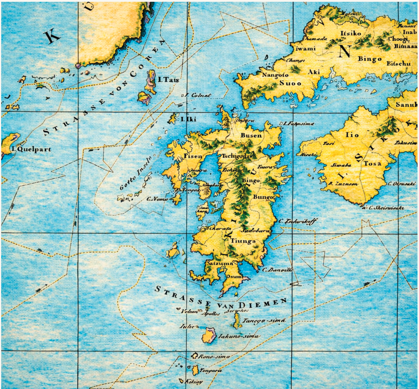
▲ Раскрашенная карта пролива Ван-Димена, в создании которой принимал участие Фаддей Беллинсгаузен во время кругосветного плавания в 1804 г.

тельность Беллинсгаузен удостоился нескольких высших наград и званий Российской империи: в 1842 году ему были пожалованы бриллиантовые знаки ордена Святого Александра Невского, годом позже его произвели в адмиралы, а в 1846 году он получил орден Святого Владимира I степени. До конца жизни Беллинсгаузен не расставался с морем, каждое лето вы-