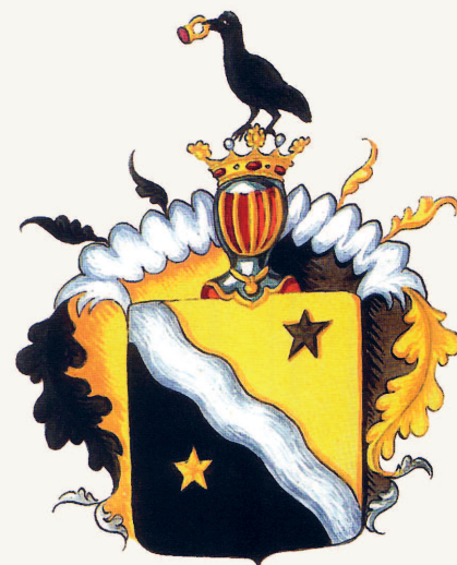
▲ Герб рода Беллинсгаузен

Усердный и добросовестный офицер, стремящийся постоянно пополнять свои знания, вскоре обратил на себя внимание командующего флотом вице-адмирала Петра Ханыкова. Когда в 1803 году Крузенштерн начал подбирать команду для участия в первом русском кругосветном плавании, Ханыков рекомендовал включить в состав одного из экипажей Беллинсгаузена. Так молодой мичман оказался на борту «Надежды», на которой обошел три океана и побывал в самых отдаленных уголках Земли. Кругосветное плавание стало для Беллинсгаузена великопленной школой, а постоянное участие в картографических и гидрографических работах, проводившихся во время экспедиции, позволило ему существенно усовершенствовать свои навыки в составлении карт. Крузенштерн, весьма ценивший Беллинсгаузена, в «Предуведомле-