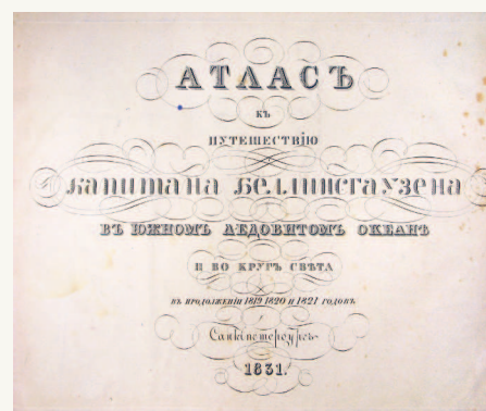
▲ Титульный лист «Атласа к путешествию капитана Беллинсгаузена»

ние на должность командующего отрядом кораблей в Средиземном море, пробыл на этом посту шесть лет и был произведен в контр-адмиралы. Во время Русско-турецкой войны, будучи командиром Гвардейского экипажа, участвовал в сражениях на Дунае и на Черном море, летом 1827 года отличился при осаде и взятии турецкой крепости Варна. В конце 1830 года Беллинсгаузен получил чин вице-адмирала и был назначен командующим 2-й флотской дивизией Балтий-