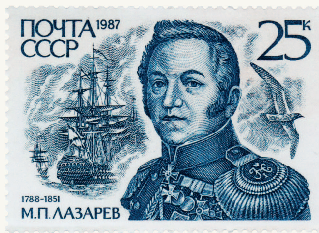
◀ Почтовые марки, выпущенные к юбилеям первого русского антарктического плавания