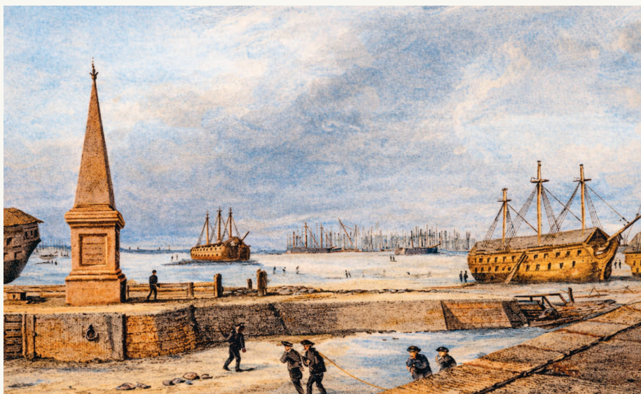
▲ Военная гавань Кронштадта. Раскрашенная гравюра

Этот срочный вызов в столицу был связан с подготовкой первой русской антарктической экспедиции. Человека, способного возглавить это сложное и опасное предприятие, искали долго. Однако имя Беллинсгаузена упоминалось еще на начальном