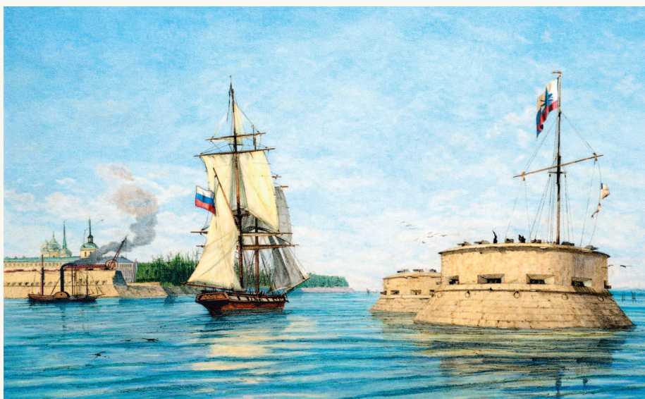
▼ Кронштадт. Вход на рейд. Раскрашенная гравюра по рисунку художника Андре Дюрана