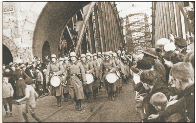
Немецкие войска маршируют через мост Гогенцоллернов — железнодорожный мост через реку Рейн. 7 марта 1936 г.

Гитлер долго не решался отдать приказ на оккупацию демилитаризованной Рейнской зоны, наблюдая за реакцией мировой общественности на войну, развязанную Италией против Эфиопии (Итало-эфиопская война 1935—1936 гг.). Обнаружилось, что, несмотря на широко разрекламированные санкции, Лига Наций на деле оказалась бессильна остановить агрессора. 2 марта 1936 г. Гитлер отдает приказ приступить к операции, но в случае противодействия со стороны французских войск наступление планировалось прекратить и стремительно отступить за Рейн. Однако ни французское правительство, ни армия не предприняли никаких действий, когда утром 7 марта отряды немецких войск перешли через Рейн и вступили в демилитаризованную зону.