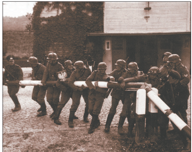
Немецкие солдаты ломают шлагбаум на пограничном пункте в Сопоте (граница Польши и Вольного города Данцига). 1 сентября 1939 г.

Наступление на Польшу началось 1 сентября 1939 г. в 4 ч 40 мин массированным ударом с воздуха. Польские военно-воздушные силы были застигнуты врасплох, что позволило немцам в короткий период добиться господства в воздухе.