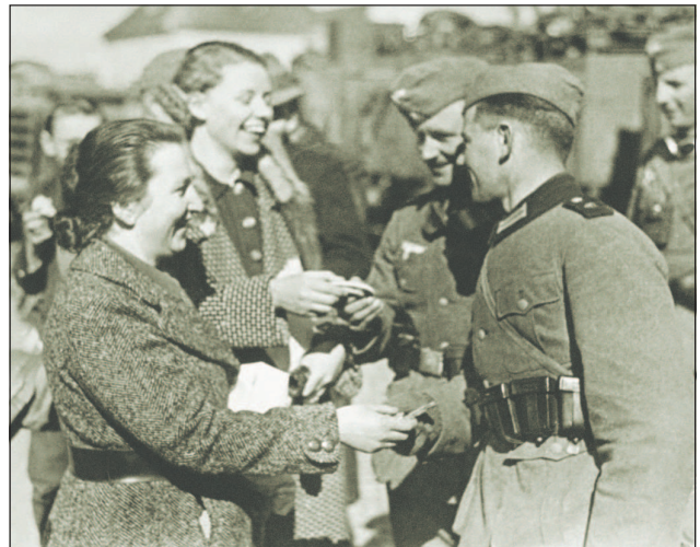
Австрийские женщины вручают подарки германским солдатам. 13 марта 1938 г.

4 февраля 1938 г. ушел в отставку главнокомандующий немецкой армией фельдмаршал Вернер фон Бломберг, и Гитлер официально объявляет себя главнокомандующим вооруженными силами. При главнокомандующем создается штаб — «верховное командование вооруженными силами» (ОКВ). Начальником главного штаба ОКВ был назначен 55-летний генерал артиллерии В. Кейтель. «Мозговым центром» штаба стало управление руководства вооруженными силами (с 8 августа 1940 г. — штаб оперативного руководства), которое возглавил генерал артиллерии А. Йодль.