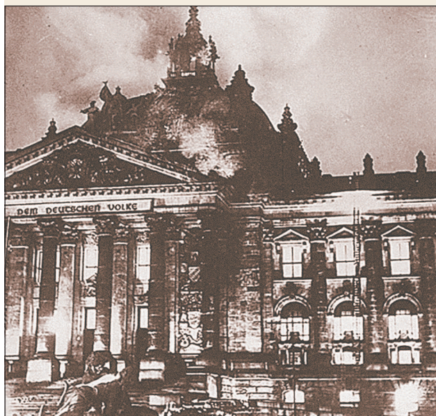
Горящее здание Рейхстага. 27 февраля 1933 г.

Нацисты объявили поджог Рейхстага результатом коммунистического заговора, направленного на срыв выборов, что позволило им начать массовые аресты коммунистов. В одном только Берлине в ночь на 28 февраля было арестовано 1500 человек, а по всей стране — более 10 тыс. коммунистов. Во время массовых арестов фашистам удалось 3 марта 1933 г. схватить Э. Тельмана, лишив компартию наиболее стойкого и целеустремленного руководителя. 28 февраля, на следующий после пожара день, Гитлер представил на подпись президенту Гинденбургу проект декрета «Об охране народа и государства», приостанавливавшего действие семи статей конституции, которые гарантировали свободу личности и права граждан.