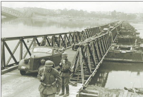
Немецкие солдаты переправляются через Вислу по мосту, построенному инженерными частями вермахта. Слева виден мост, разрушенный отступающей польской армией. 16 сентября 1939 г.

Не получив обещанной союзниками помощи, польские войска с боями отступали к Варшаве, пытаясь остановить продвижение армий группы «Юг». К моменту ввода в сражение армия «Прусы» еще не успела развернуться. 4 сентября в район Петркува прибыли только 19-я и 29-я пехотные дивизии и Виленская кавалерийская бригада. Эти соединения заняли оборону на широком фронте в значительном отрыве друг от друга. Связь со штабом армии «Лодзь» отсутствовала. Днем 5 сентября части 10-й немецкой армии вышли на подступы к Петркуву и при поддержке авиации атаковали 19-ю польскую пехотную дивизию и вышли в тыл армии «Прусы». Это вызвало панику в войсках, вскоре распространившуюся на весь участок фронта вплоть до Варшавы.