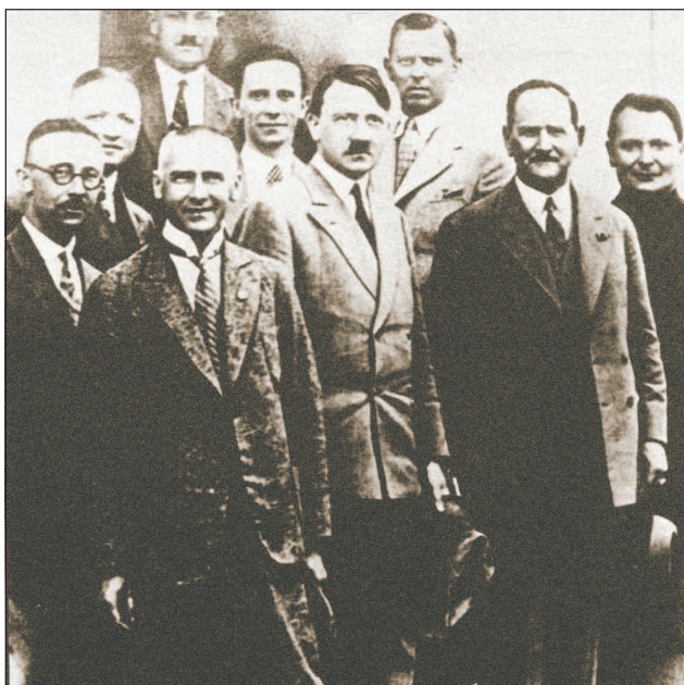
Руководство НСДАП в конце 1920-х гг. В центре А. Гитлер, который занимал пост председателя партии с 29 июля 1921 г. по 30 апреля 1945 г.

президенты, главы правительств, послы, министры и маршалы двадцати шести стран. В этот же день состоялось подписание Версальского мирного договора с Германией, официально завершившего Первую мировую войну. Отдельными статьями договора существенно ограничивалась военная мощь Германии. В частности, Германии запрещалось иметь многие современные виды вооружения, например боевую авиацию и бронетехнику.