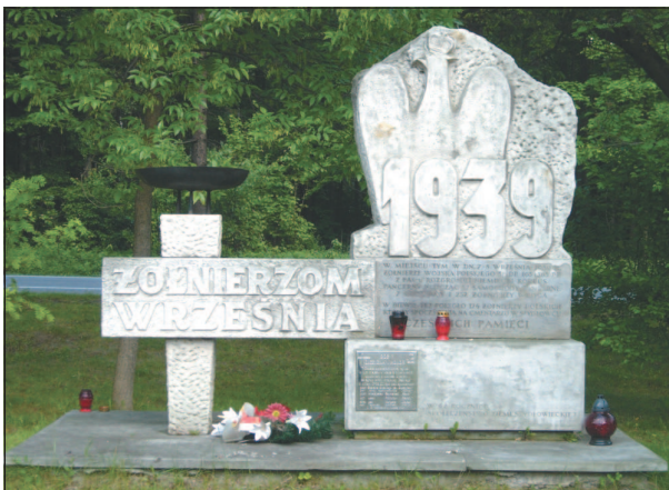
Памятник польским солдатам, погибшим в бою с немецкими войсками 6—7 сентября 1939 г. во время обороны города Краков.