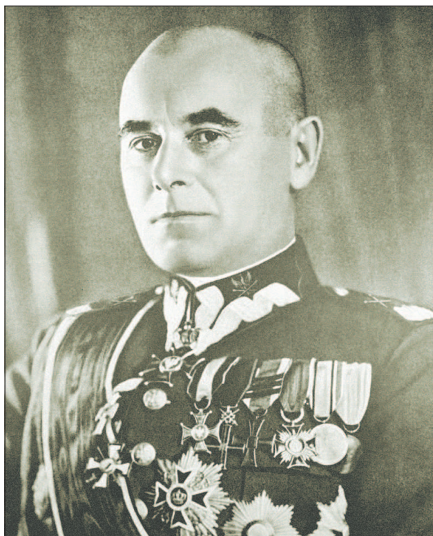
Верховный главнокомандующий польской армией в начале Второй мировой войны Э. Рыдз-Смиглы (1886—1941).