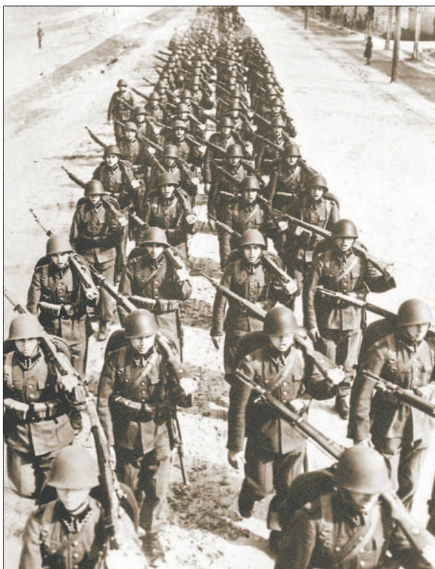
Польские пехотинцы на марше. 1939 г.