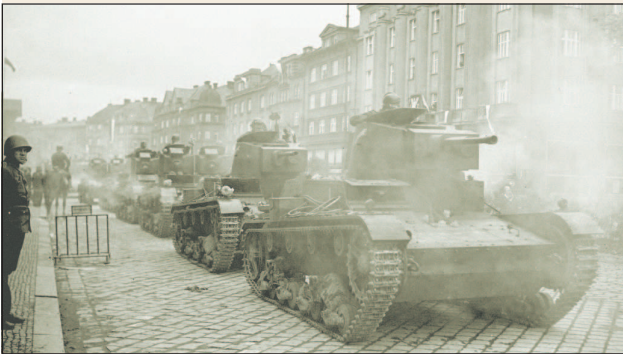
Польские танки на территории Чехословакии.

В ночь с 30 сентября на 1 октября Польша, а затем и Венгрия, правительства которых были воодушевлены решениями Мюнхенской конференции, предъявили Чехословакии ультиматум о передаче территорий, населенных польским и венгерским национальными меньшинствами. Уже на следующий день польские части вошли на территорию Тешинской области, находящейся на севере Чехословакии, и в первые же два дня заняли территорию, на которой проживало 80 тыс. поляков и 125 тыс. чехов.