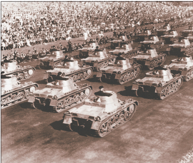
Танки на параде в 1935 г., посвященном Эрнтданкфесту — национальному празднику урожая. Создание бронетанковых войск в Германии являлось грубейшим нарушением положений Версальского договора.