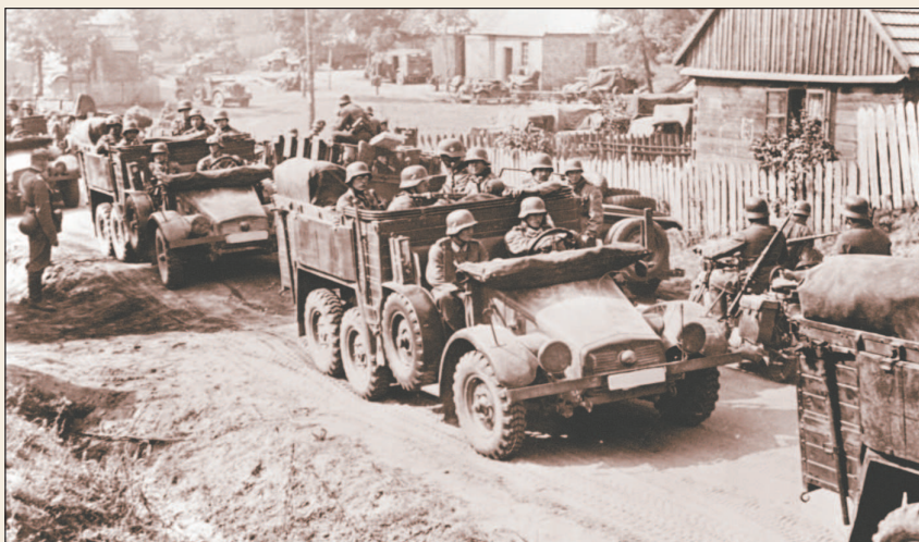
Моторизованные части вермахта в Польше. 1939 г.

Успешному продвижению германских войск во многом способствовало активное использование бронетанковых и моторизованных войск. В отличие от Первой мировой войны, когда наступление шло медленно и одновременно по всему фронту, новая тактика германских войск основывалась в большей степени на быстрой наступательной операции. Основная задача заключалась в прорыве обороны противника и дальнейшем развитии наступления вглубь, а не по всему фронту. При этом узлы сопротивления, укрепленные районы, противотанковые препятствия, населенные пункты обычно обходились или отыскивались участки наименьшего сопротивления, ведущие в тыл противника. Такая тактика во многом была рискованна, так как по логике вещей противник мог легко отрезать прорвавшиеся части. Однако этот риск сводился к нулю благодаря разрушению механизмов управления войсками, подавлению морального духа противника и налаживанию умелого взаимодействия между своими родами войск.