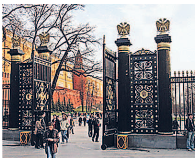
Ворота Александровского сада

① Наша прогулка по Кремлю и его окрестностям начинается от обращенных к Историческому музею ворот Александровского сада . Он был разбит в 1820 г. по проекту архитектора О.И. Бове на месте русла убранной под землю реки Неглинки. Сад стал своеобразным памятником войне 1812 г. У Средней Арсенальной башни был сооружен грот в стиле античных руин, напоминающий о пожаре Москвы 1812 г., крылья которого облицованы обломками московских зданий, разрушенных наполеоновской армией. В 1914 г. в саду был установлен obelisk в память 300-летия династии Романовых . В 1918 г. на его гранях вместо имен Романовых были вырезаны имена революционных мыслителей. В мае 1967 г. в Александровском саду был устроен мемориал Неизвестному Солдату , прах которого был перенесен сюда с 41-го километра Ленинградского шоссе — места кровопролитных боев осенью 1941 г.