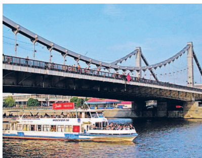
Речной трамвай у Крымского моста