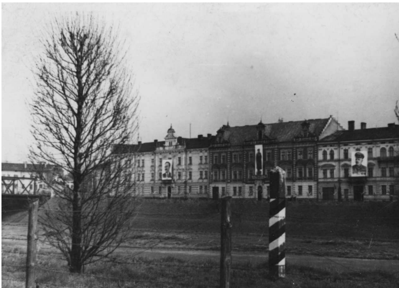
Линия границы между обоюдными государственными интересами Германии и СССР в Перемышле, 1939 год