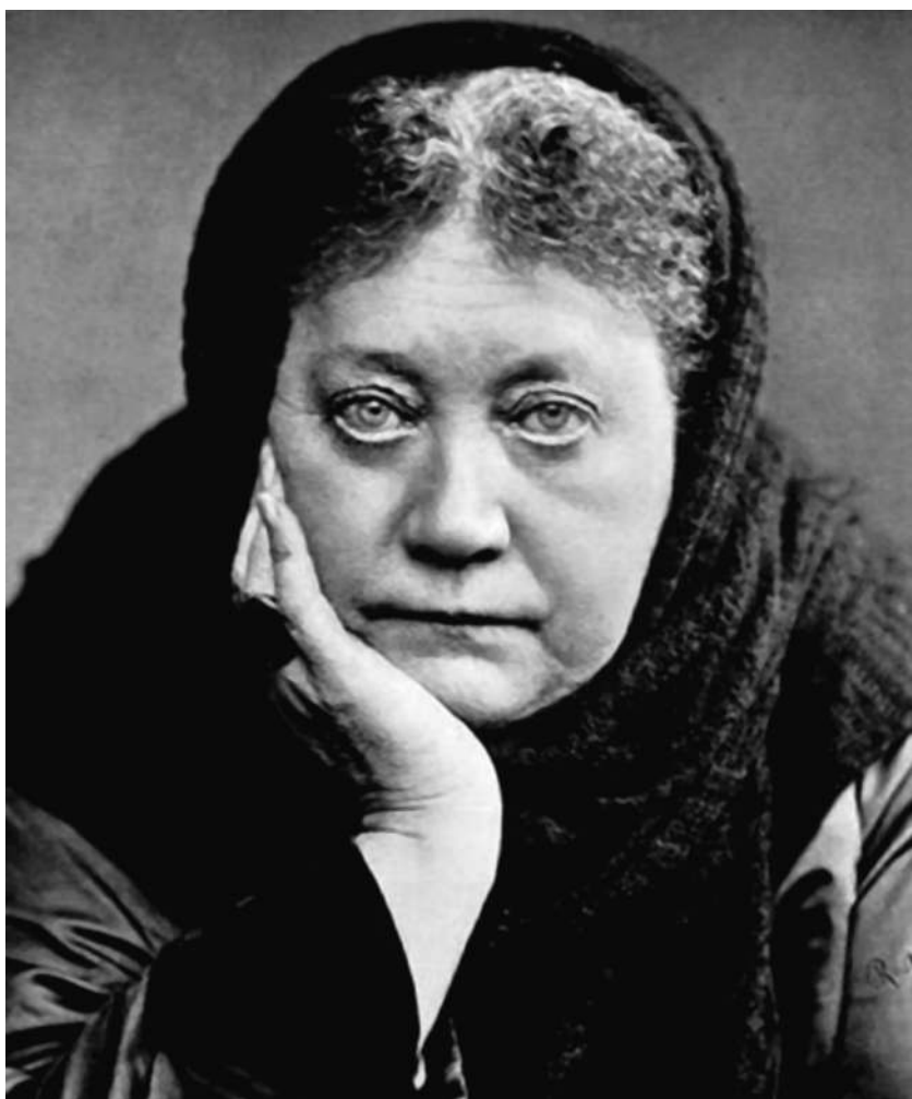
Елена Петровна Блаватская