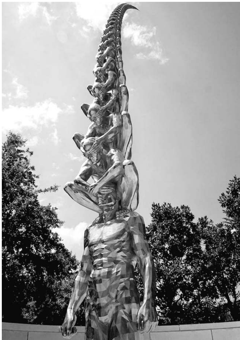
Карма. Скульптура в Новом Орлеане, штат Луизиана