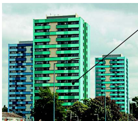
block of flats многоквартирный дом