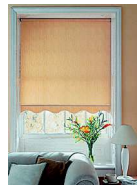
roller blind штора