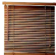
venetian blind жалюзи