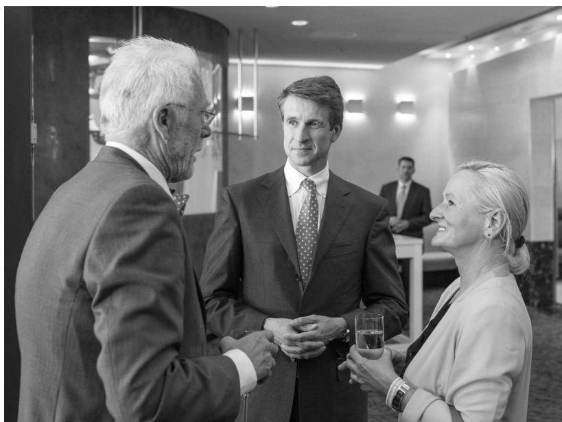
Штефан Квандт на вручении премии им. Герберта Квандта в области журналистики во Франкфурте, 2014 год

щим BMW. В известном списке самых богатых людей американского журнала Forbes в графе «Источник состояния» стояло бы: inherited (англ. «унаследовано»). Конечно, это утверждение — не ложь, однако оно скрывает истинную картину. Да, брат и сестра Квандт унаследовали немалое богатство.