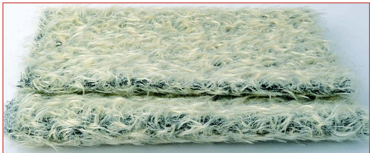
Мохер с длинным ворсом

Несмотря на то что цветовая гамма современного мохера очень обширна, вы можете самостоятельно окрасить исходную белую ткань для получения своего уникального оттенка или смешанной структуры цветовых пятен. Для таких целей подходят как обычные красители для ткани, так и специализированные краски для мохера.