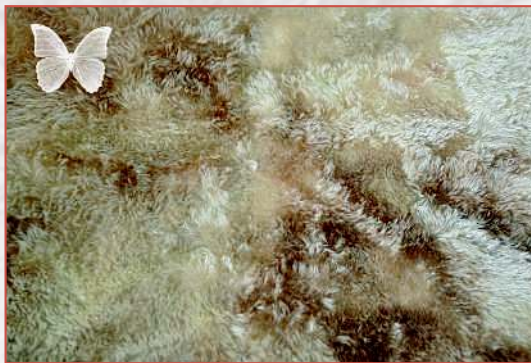
Окрашенный вручную мохер с цветовыми пятнами

От длины ворса зависит использование конкретной ткани для медведя определенного размера. Очень короткий ворс-щетка длиной в несколько миллиметров подходит для миниатюрных медвежат (до 8 см). Из мохера с редким ворсом средней длины шьют медведей в стиле «антик» или «ретро» размером до 25–30 см и выше. Часто мохер специально дополнительно состаривают: наносят на ткань искусственные повреждения, пятна, путают направление ворса, чтобы симитировать старинную игрушку. Из мохера с длинным волнистым ворсом шьют фантазийных авторских мишек с необычными аксессуарами и одеждой. Хочу отметить, что каких-то строгих правил для работы с мохером нет, каждый автор сам решает, какой вид ткани использовать для своих творений.