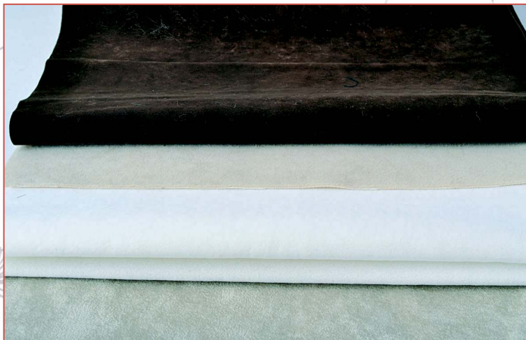
Вспомогательные ткани для лапок и ушей

вы можете использовать вместо вспомогательных тканей тот же мохер (вискозу), из которого шьете мишку. Изменить его внешний вид можно, полностью выщипав ворс, или пришивая к изделию изнаночной стороной. Тогда цветовая гамма полностью совпадет.