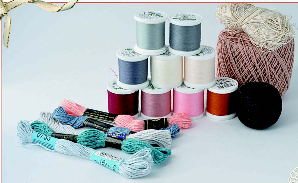
Нитки для шитья, мулине, ирис

Для вышивания носа и рта подойдут мулине или ирис натуральных оттенков (черный, коричневый и т.д.).