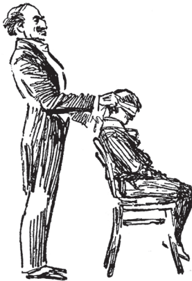
Фокусник завязал мальчику глаза

Несколько человек из публики были допущены на сцену, чтобы удостовериться в отсутствии обмана.