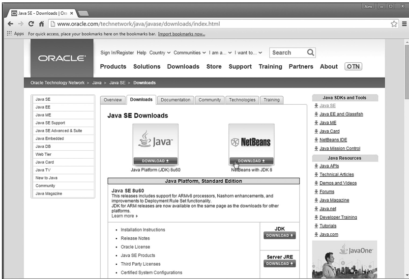
Рис. В.2. Окно браузера открыто на странице загрузки установочного файла пакета JDK и среды разработки NetBeans

После щелчка по гиперссылке для загрузки программного обеспечения для работы с Java, переходим на еще одну страницу, с которой собственно и выполняется загрузка (рис. В.2).