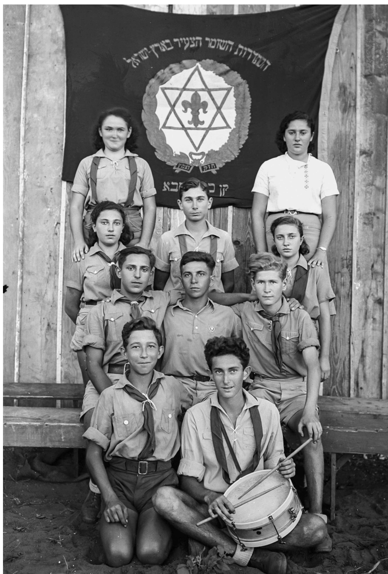
Группа членов «Хашомер хацаир» в Зрец-Израэль