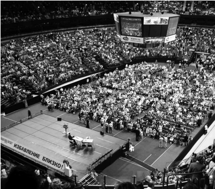
Областной конгресс «Свидетелей Иеговы»* в Санкт-Петербурге, 2005 год

к организации. Годом позже, в 2000 году, в пятнадцатилетнем возрасте их примеру последовал и я.