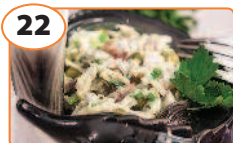
22 Салат с копченой скумбрийей