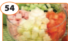
54 Салат «Для двоих»