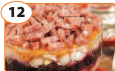
12 Салат «Лохматый»