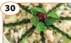
30 Салат с куриным филе и огурцами