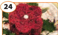
24 Салат со свеклой и черносливом