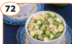
72 Салат с авокадо, яблоком и куриным филе