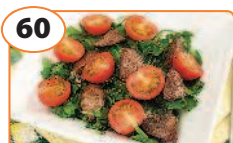
60 Салат с куриной печенью и помидорами черри