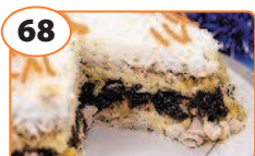
68 Салат «Новогодний»