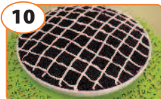
10 Салат «Правительственный»