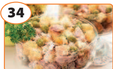
34 Салат с сухариками, горошком и копченым окорочком