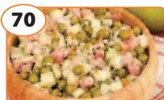
70 Салат с квашеной капустой, ветчиной и яблоком