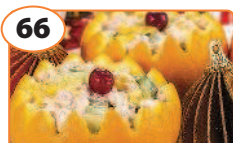
66 Салат с куриным филе и огурцами в апельсине