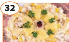
32 Салат с куриным филе, рисом и ананасами