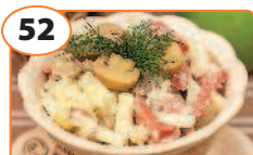
52 Салат с колбасой, картофелем и грибами