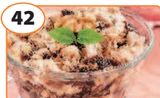
42 Салат с куриным филе, черносливом и орехами