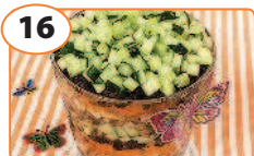
16 Салат «Обжорка»