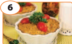
6 Салат «Любимый»