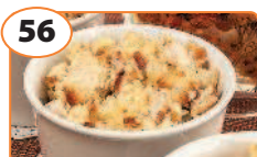
56 Салат с куриным филе, сухариками и ананасами