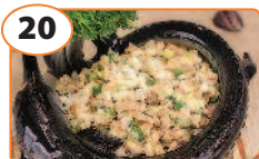
20 Салат из консервированной горбуши