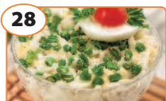
28 Салат с кальмарами, яблоками и сыром