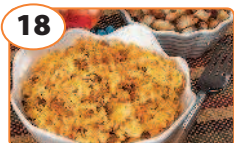
18 Салат с сухариками, сыром и морковкой