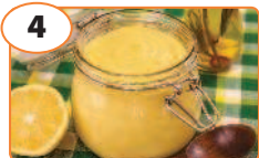
4 Майонез «Домашний»