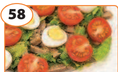
58 Салат с мясом, помидорами и яйцами