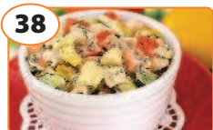
38 Салат с авокадо, куриным филе, помидорами и перцем