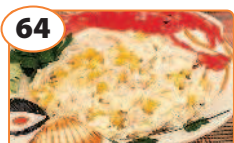
64 Салат с кальмарами и кукурузой