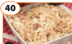
40 Салат с печенью трески, рисом и яйцами