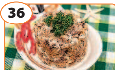
36 Салат с тунцом и сухариками