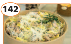
Салат с говядиной, кольраби и помидорами