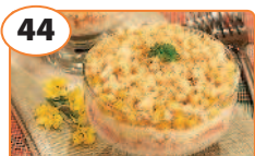
44 Салат «Крабик»