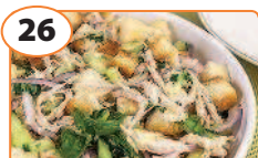
26 Салат «Хрустящий»