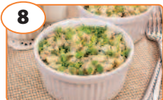
8 Салат «Ночь»