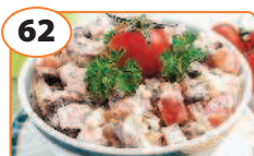
62 Салат с ветчиной, грибами и помидорами черри