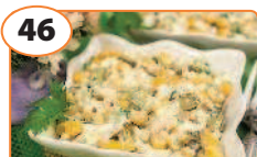
46 Салат с мясом криля