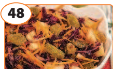
48 Салат с капустой, яблоком и изюмом