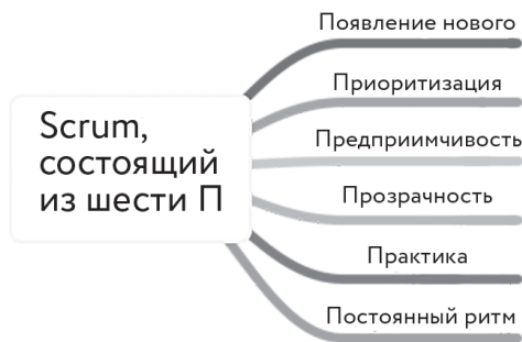
Рисунок 1.2 — 6 свойств Scrum

В мире организаций, где центральное место все еще занимает процессный подход и индивидуализация целей, Scrum сильно выделяется.