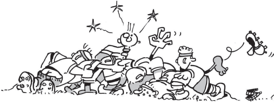
Рисунок 1.1 — Схватка

Вот почему мы не пишем SCRUM. И вот почему мы произносим именно так: скрам. Если хотите убедиться в своем правильном произношении, включите матч по регби с англофонным арбитром.