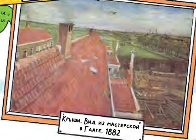
КРЫШИ. ВИД ИЗ МАСТЕРСКОЙ в ГААГЕ. 1882