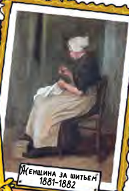
ЖЕНЩИНА ЗА ШИТЬЕМ 1881-1882