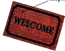
der Fußabtreter коврик