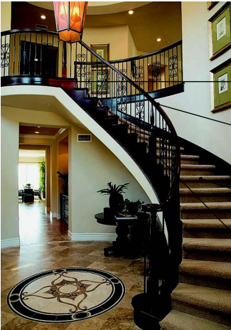
die Diele прихожая