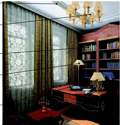
das Arbeitszimmer кабинет