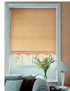
der Rollvorhang штора