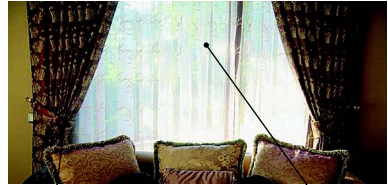
der Vorhang портьера