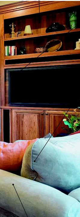
die Vitrine сервант