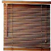
die Jalousie жалюзи