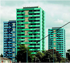
der Wohnblock многоквартирный дом