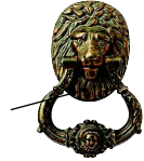
der Türklopfer дверное кольцо