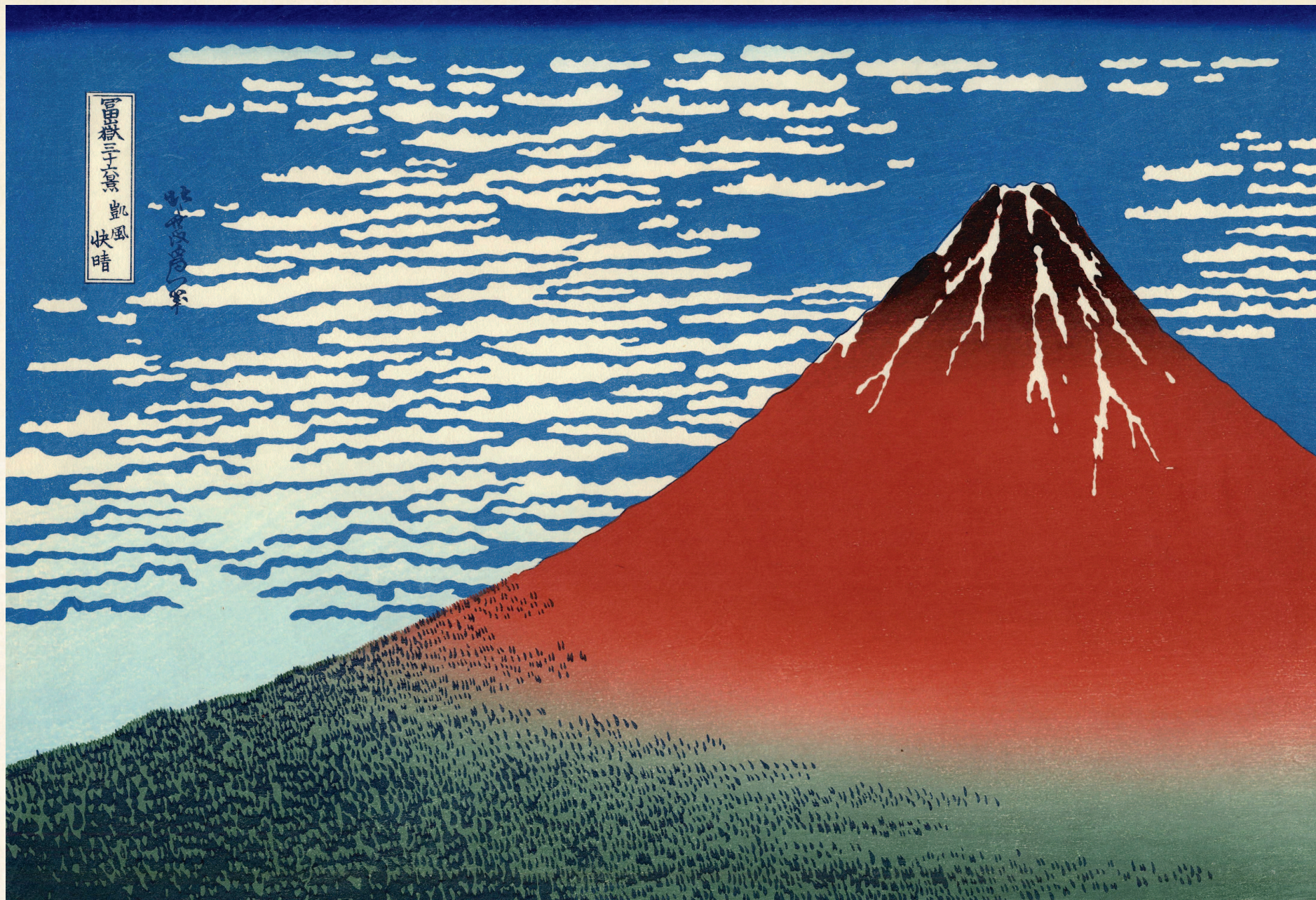
«Победный ветер. Ясный день (Красная Фудзи)», The Metropolitan Museum of Art