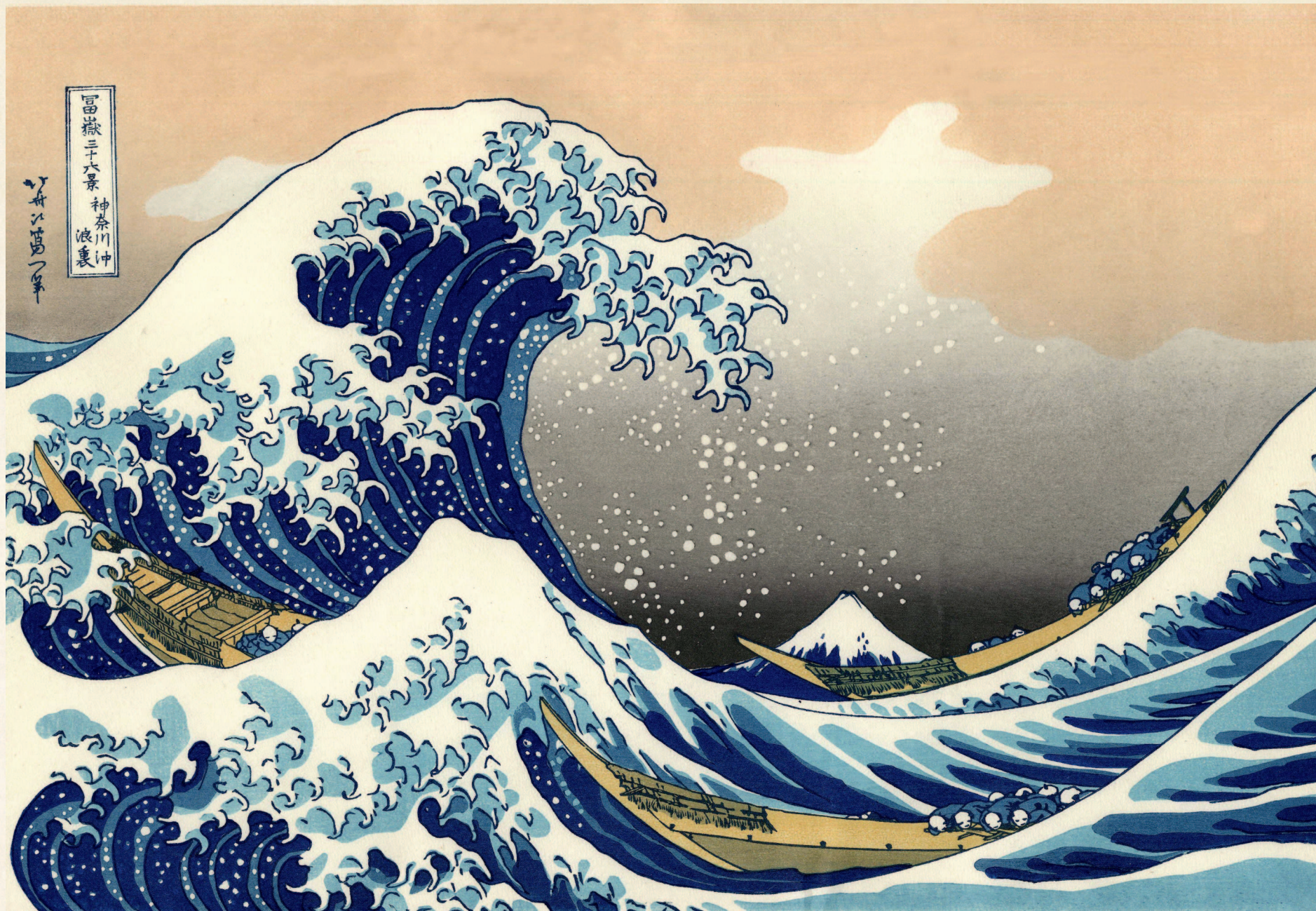
«Большая волна в Канагаве», The Metropolitan Museum of Art