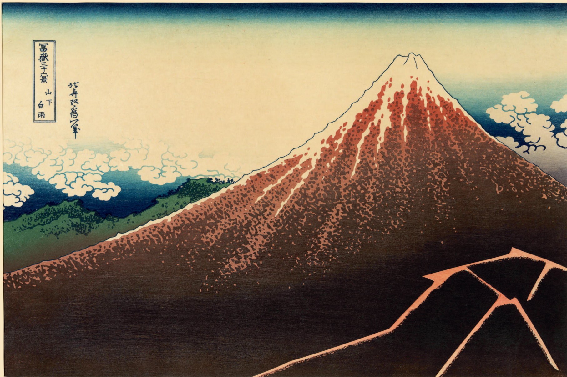
«Ливень под горой», The Metropolitan Museum of Art