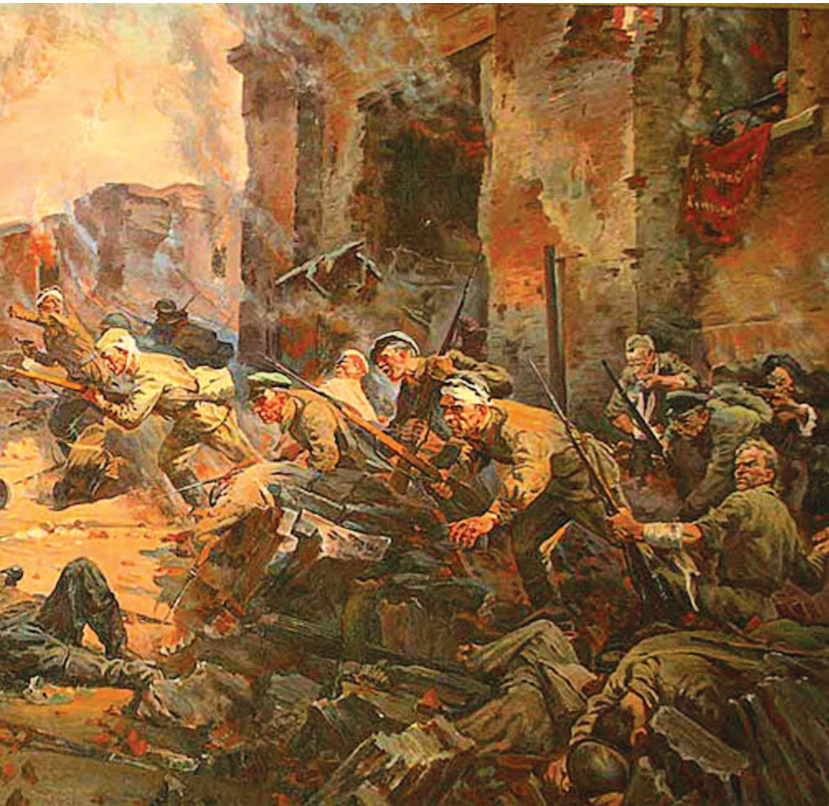
Защитники Брестской крепости. Художник П.А. Кривоногов