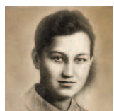
Космодемьянская Зоя Анатольевна