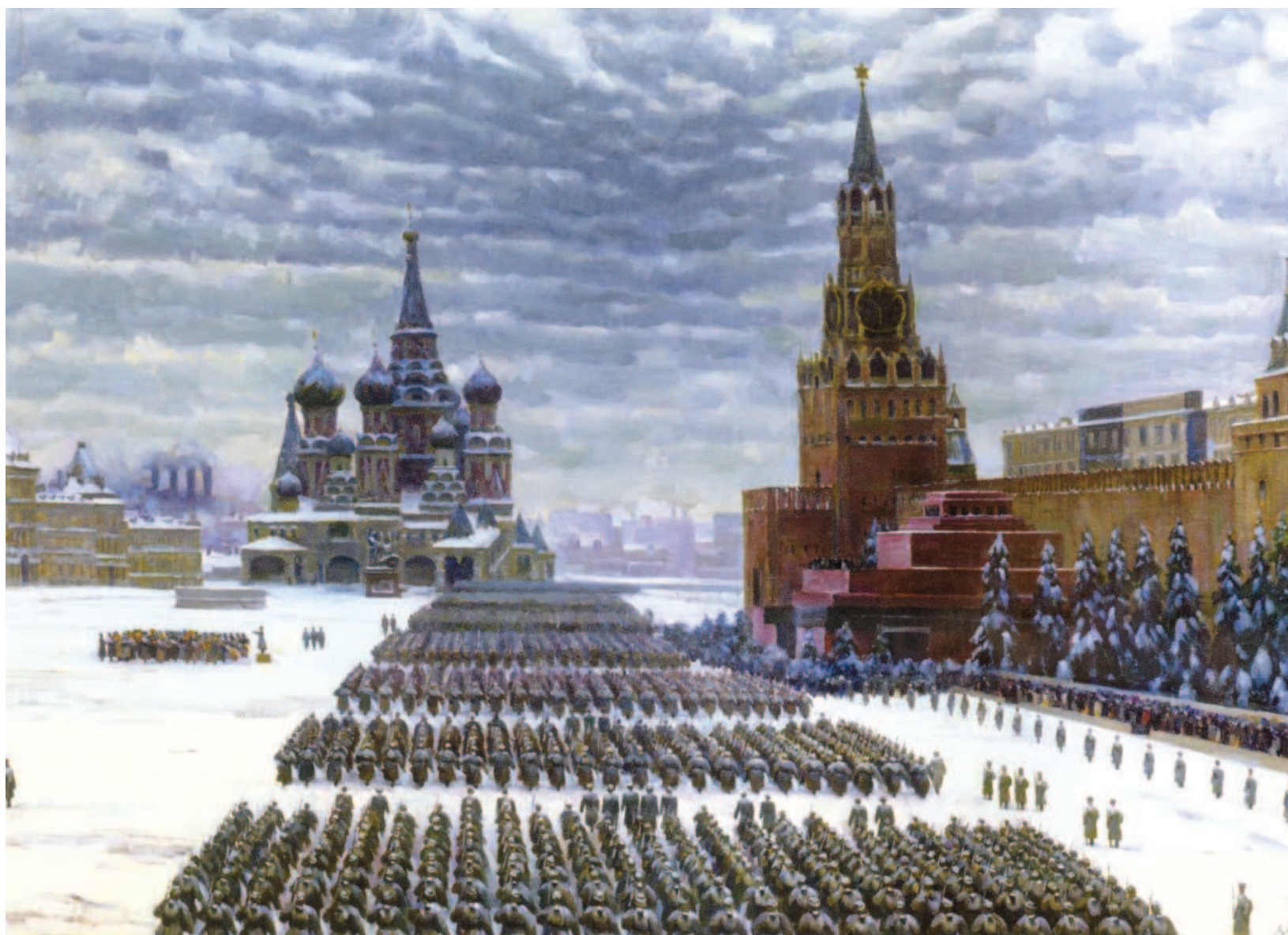
Парад на Красной площади в Москве 7 ноября 1941 года. Художник К. Юон

Между Москвой и Зорге начинают портиться отношения. Кремль не устраивает слишком