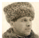
Доватор Лев Михайлович