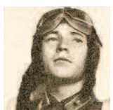
Талалихин Виктор Васильевич