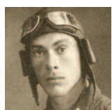
Гастелло Николай Францевич