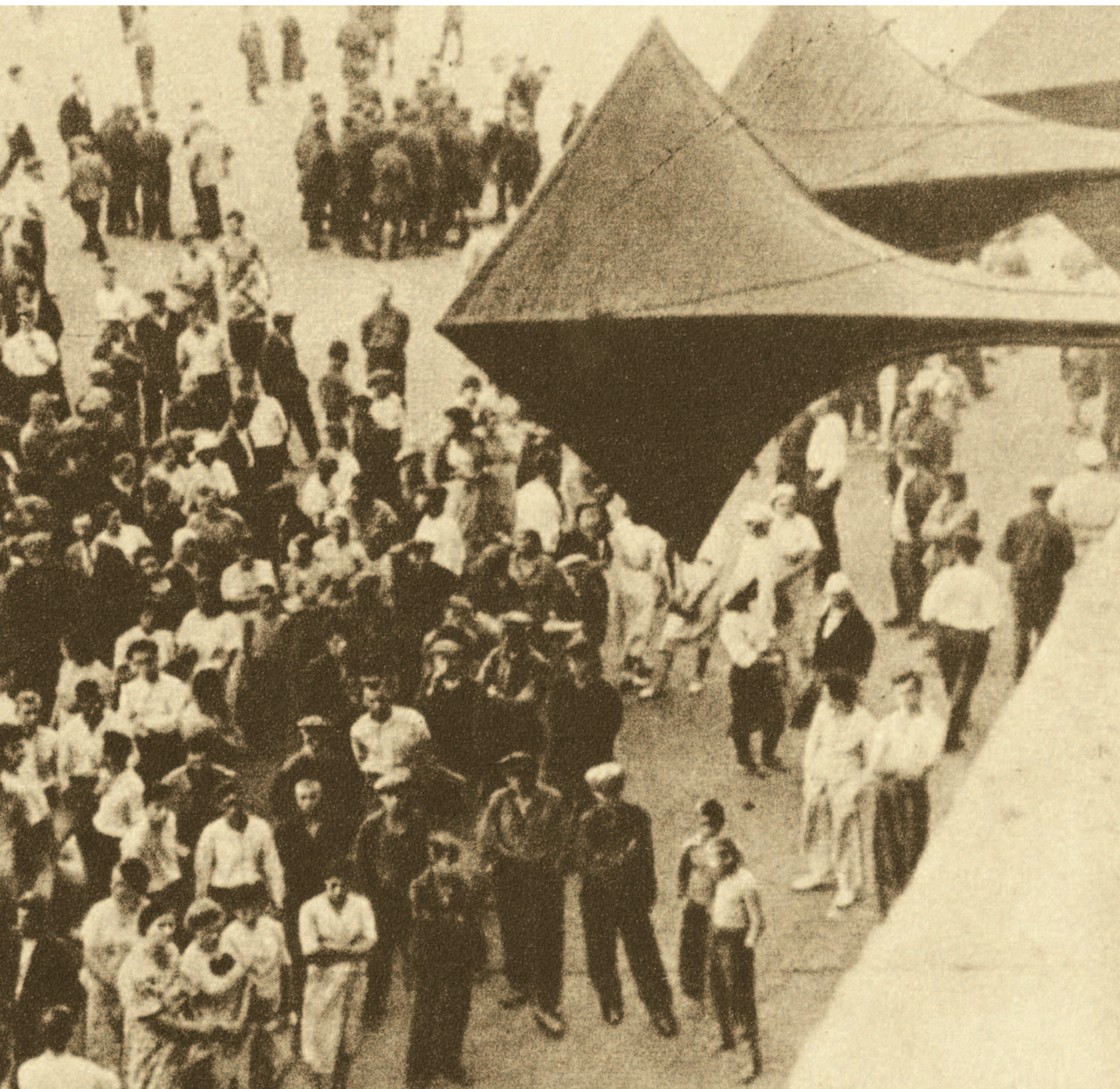
Москвичи слушают сводку Совинформбюро