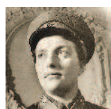
Павличенко Людмила Михайловна