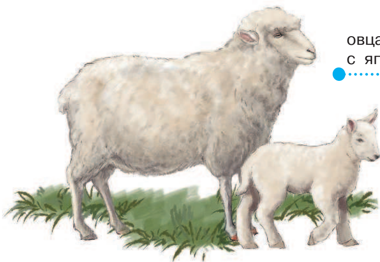
овца с ягнёнком

У диких баранов грубая и жёсткая шерсть. Домашние овцы покрыты мягкой и густой шерстью. Состриженная с овец шерсть называется руном. Наибольшее количество тонкого и тёплого руна дают овцы-мериносы. Из шерсти и шкур делают ковры и ткани, вяжут тёплые головные уборы, дублёнки и шубки. Благодаря овечкам нам не страшна холодная зима.