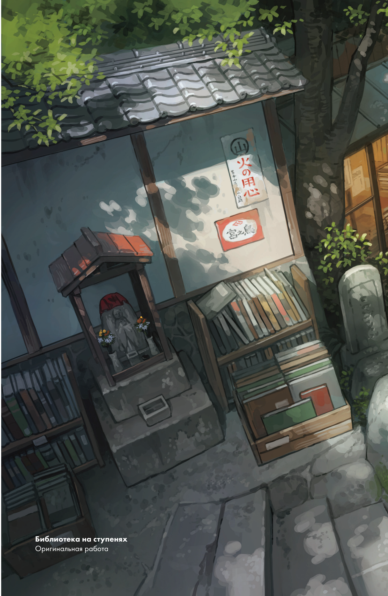
Библиотека на ступенях Оригинальная работа