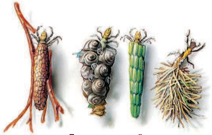
Личинки ручейника в домиках

— Вот именно. Они облепляют себя со всех сторон песчинками, мелкими ракушками, кусочками листьев. И ползают в этих домиках по дну. Их даже в нашей речке сколько хочешь!