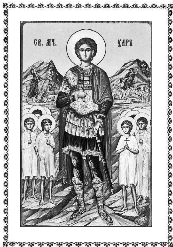
Мученик Уар Египетский и иже с ним. Литография. Конец XX века. Россия.