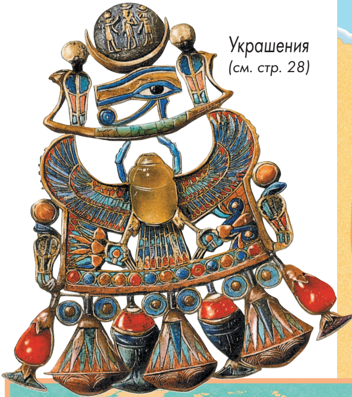
Украшения (см. стр. 28)