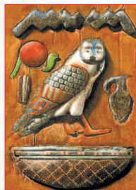
Древнеегипетский иероглиф. Сова обозначает букву «м».

Древние египтяне изобрели одну из самых ранних в мире форм письменности. Их система письма, названная иероглифической, использовалась уже более 5000 лет назад. Она состоит из сотен знаков: одни обозначают целые слова, тогда как другие — звуки и буквы.