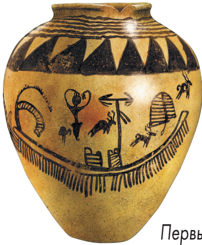
Первые династии (см. стр. 8–9)