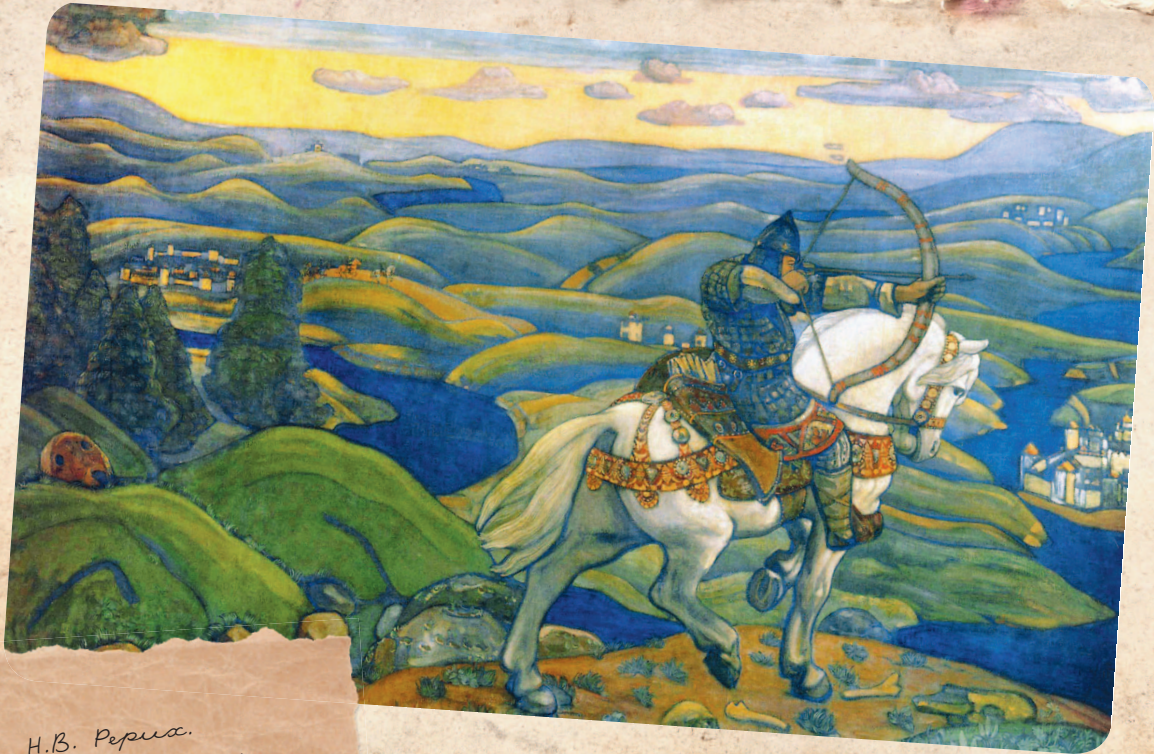
Н.В. Перина. Илья Муромец. Декоративное панно. 1910

Наверное, ни одна сказочная тема не вызывает у современного человека такой ностальгии, как тема силы. В современном мире всё наоборот: ума предостаточно, а вот силы не хватает. Современный человек всё понимает, всё знает, а сделать ничего не может или не хочет. И самая частая присказка: «сил нет». Мы живем в уставшем мире, бессильном мире, и не видно вокруг витязей и богатырей (и даже Терминатор стал всего лишь губернатором). Куда же всё делось? В чем тайна богатырской силы? На поиски ответов нужно отправляться на страницы сказок и легенд, туда, где бродят по свету и совершают свои славные подвиги могучие герои.