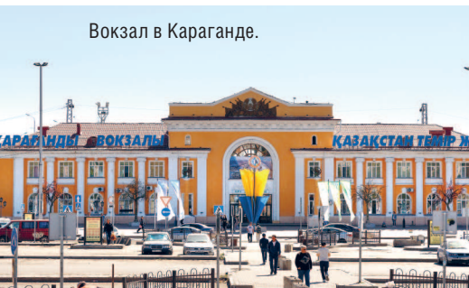
Вокзал в Караганде.

Один раз в день по понедельникам, средам, пятницам и субботам курсирует электричка из Омска (Россия, Омская обл.) в Петропавловск (Казахстан, Северо-Казахстанская обл.). Время в пути — 4 часа 35 мин.