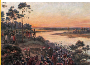
В. Мазуровский. Переход через Неман

Все это поистине напоминало переселение народов или вавилонское столпотворение. В составе армии Наполеона были швейцарцы, поляки, хорваты, саксонцы, вестфальцы, австрийцы, баварцы, пруссаки, далматинцы, испанцы, португальцы, бельгийцы и голландцы.