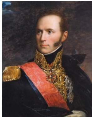
Арман Луи де Коленкур (1773–1827), маркиз, герцог Винченский, дивизионный генерал. В 1807–1811 годах Коленкур — посол в Санкт-Петербурге.

Вернувшись из Петербурга в Париж, Коленкур убеждал императора установить мир с Россией и избежать войны. Наполеон отвечал: «Да одна хорошая битва покончит с этой прекрасной решимостью вашего друга Александра и со всеми его фортификациями, сделанными из песка».