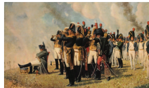
В. В. Верещагин. Наполеон на Бородинских высотах. 1817 г.

«Во всех отношениях мы перебивались кое-как; уже мало было хлеба, а мука, молоко, вино и водка сделались большой редкостью. Вследствие жары и скверной воды мы забирались в ледники и захватывали с собой куски льда, которые переходили из рук в руки... Для лошадей лишь очень редко находилось сено и овес, а когда это и случалось, лошади не могли размолоть овес зубами, пригупленными вследствие питания травой и зерновым кормом».