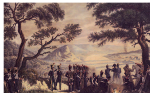
Х.В. Фабер дю Фор. На берегу Немана (13 (25) июня 1812 года)

Манифесты, написанные Шишковым, зачитывались по всей России. Фактически он блестяще сыграл роль своего рода главного идеолога Отечественной войны. Его манифесты поднимали дух русского народа, усиливали и укрепляли его патриотический дух, поддерживали в тяжелые дни поражений. Ему был пожалован орден Александра Невского «За примерную любовь к Отечеству».