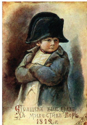
Открытка «Страшен был враг, да милостив Бог!», 1812 год, Елизавета Бен

Однако по трем очень важным вопросам Нарбонну не удалось составить верное мнение. Во-первых, он полагал, что в случае войны сражение будет дано сразу же после вторжения Наполеона в Россию и оно будет приграничным. Во-вторых, по его сведениям, между Россией и Швецией не заключен союз, хотя Швеция, вероятнее всего, и против Наполеона. В-третьих, Нарбонн считал, что мир России с Турцией не удастся подписать еще очень долгое время.