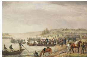
А. Альбрехт. Переход итальянского корпуса Евгения Богарне через Неман