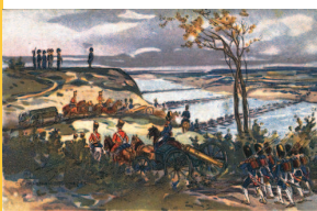
Открытка. Переправа Наполеона через Неман

Многие из них оказались в составе Великой армии по принуждению, как, например, насильно собранные испанские и португальские батальоны, некоторые — в силу заключенных их государствами союзов с наполеоновской Францией (Италия, Австрия, Рейнский союз, Пруссия), третьи — по причине вхождения их земель в состав Французской империи в качестве провинций или нахождения в разного рода зависимости от Франции (поляки, хорваты, бельгийцы). Каждый из полков имел свои отличительные знаки, свою форму, свои традиции, для многих из солдат этот поход стал первым столь далеким путешествием. От всего этого мощного движения создавалось ощущение, что война идет не между Францией и Россией, а между Европой и восточными варварами.