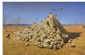
В. В. Верещагин. Апофеоз войны

В данной книге собраны статьи, посвященные самым важным и интересным вопросам, связанным с историей войны. Вы сможете прочитать хронику каждого дня войны, как если бы получали донесения с поля военных действий, и узнать больше об отдельных людях, в той или иной степени повлиявших на ход событий в каждый период войны.