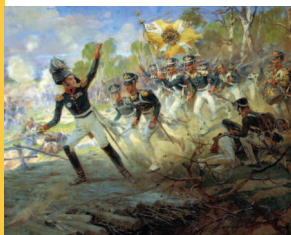
Н. Самокиш. Подвиг солдат Н.Н. Раевского под Салтановкой 11 июля 1812 года