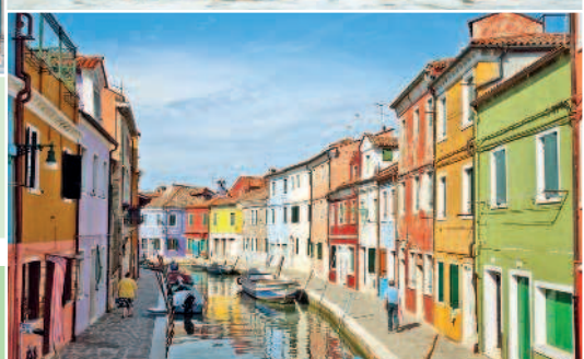
Рим, собор Св. Петра Рим, Колизей Музей Ватикана, Лакоон Венеция, гондольеры Венеция, Бурано