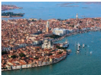
Венеция с высоты птичьего полет

Большая часть Италии занята горными массивами Альп и Апеннин. В предгорьях Апеннин рядом с Римом находятся озера вулканического происхождения: Браччано, Больсена, Вико. На юге Италии в областях глубоких разломов земной коры находятся одни из крупнейших в мире действующих вулканов – Этна и Везувий. В Италии периодически происходят извержения вулканов и сильные землетрясения. Последнее землетрясение в Кузано-Мутри, в 60 км к северо-востоку от Неаполя, произошло в январе 2014 года.