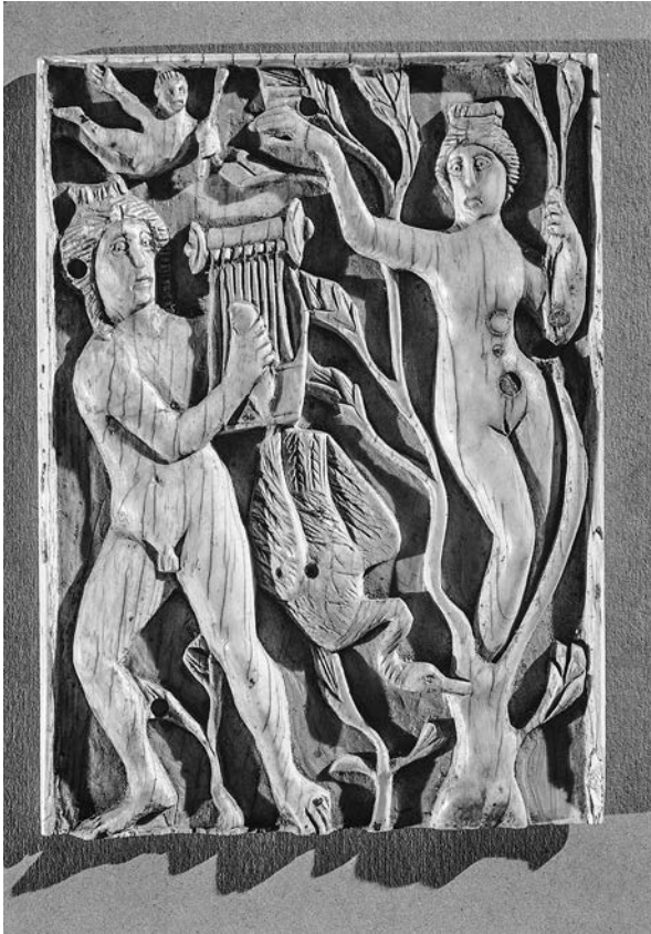
Ил. 13. Аполлон и Дафна (резьба по слоновой кости, коптское искусство). Египет, V в. н. э.

лень листья превращаются, руки же — в ветви; резвая раньше нога становится медленным корнем, скрыто листвою лицо, — красота лишь одна остается» 14 .