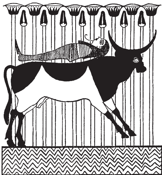
Ил. 11. Апис в обличье быка переносит усопшего в обличье Осириса в подземный мир (резьба по дереву). Египет, 700–650-е гг. до н. э.

с царем-отцом, или божия дочь Ева, уже созревшая к тому, чтобы покинуть идиллию райского сада, или достигший высшей степени сосредоточения Будущий Будда, на пути к последним горизонтам сотворенного мира, — во всех этих случаях активируются одни и те же архетипные образы, символизирующие опасность, утешение, испытание, переход и загадочную святость таинства рождения.