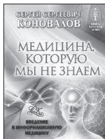
Медицина, которую мы не знаем