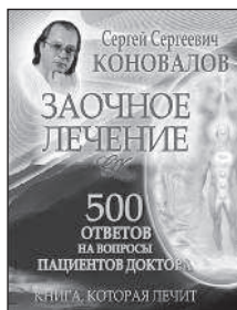
500 ответов на вопросы пациентов доктора