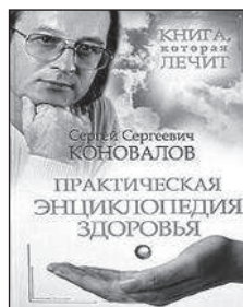
Практическая энциклопедия здоровья