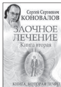
Заочное лечение Книга вторая