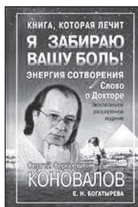
Я забираю вашу боль!