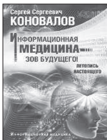
Информационная медицина — зов будущего!