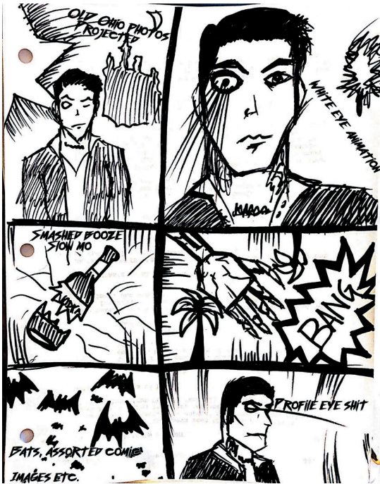
Раскадровка для музыкального клипа Westwood Road