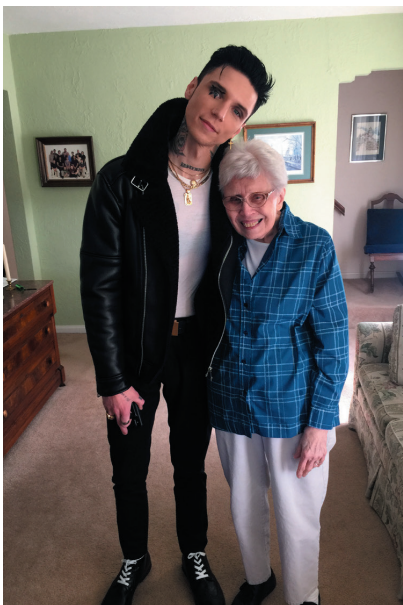
Я с бабушкой, припл. 2019 г.