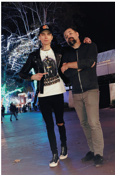
С Райаном Дж. Дауни