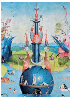
Иероним Босх 80