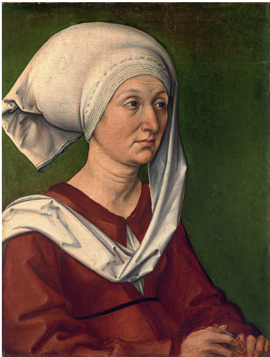
Портрет Барбары Дюрер, матери художника. 1490. Германский музей, Нюрнберг