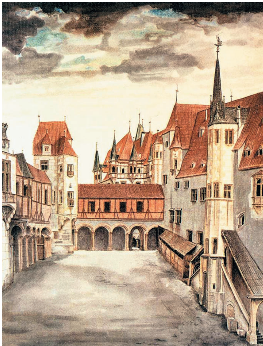
Дворик замка в Инсбруке. Акварель. 1494. Галерея Альбертина, Вена