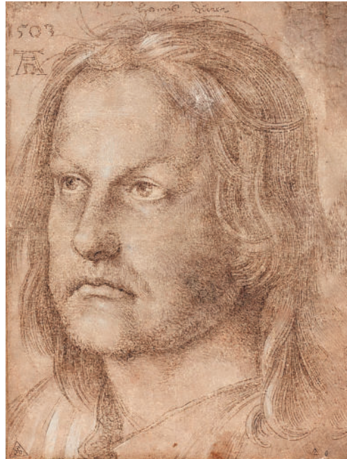
Ганс Дюрер (?), брат Альбрехта. 1503. Гравюра

В соответствии с духом времени в 1498 г. Дюрер выполнил серию больших гравюр на тему пророческих предвидений, порожденных умонастроениями эпохи. Эти листы наполнены потрясающей покорностью судьбе. Дело в том, что эпоха около 1500 г. была вся пронизана огромным внутренним напряжением, предчувствием конца света, ожиданием катастроф. Хотя старый средневековый мир терял силу, многие люди еще часто обращались к древним пророчествам, искали в них новый смысл. Неслучайно тогда же были созданы его гениальные эсхатологические гравюры к «Апокалипсису» (1496–1498) — видения ужасающих событий, космических катастроф, мрачные фантазии в духе средневекового искусства. В одном из рисунков звездообразный град низвергается на людей: богатых и нищих, бродяг, императора и папу, отчаянно стремящихся спастись. Огненное бедствие, сверхъестественная сила