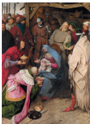
Питер Брейгель 146