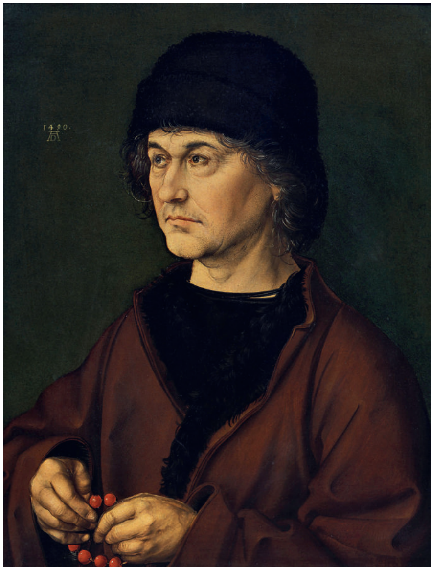
Портрет отца Альбрехта Дюрера Старшего. Около 1490. Галерея Уффици, Флоренция