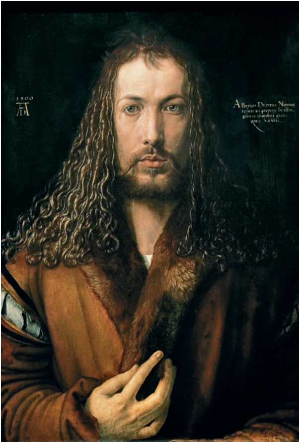
Автопортрет в образе Христа. 1500. Старая пинакотека, Мюнхен

Победитель. Второй — с огромным мечом, ослепленный яростью — Война. Третий — богато одетый, с весами в руке — Голод. Четвертый, исхудавший старец с трезубцем — сама Смерть. С неистовым драматизмом и экспрессией повествует Дюрер о грядущих ужасах, ожидающих человечество.