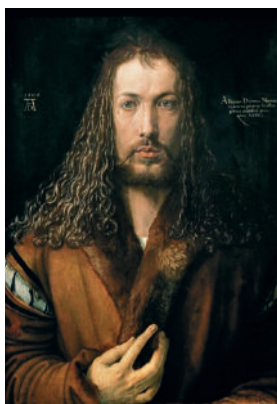
Альбрехт Дюрер 9