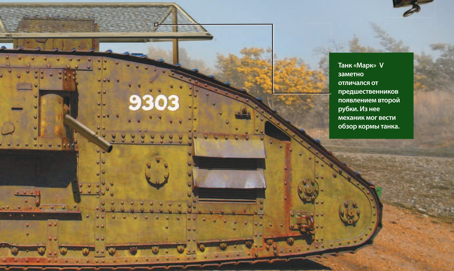
Танк «Марк» V заметно отличался от предшественников появлением второй рубки. Из нее механик мог вести обзор кормы танка.