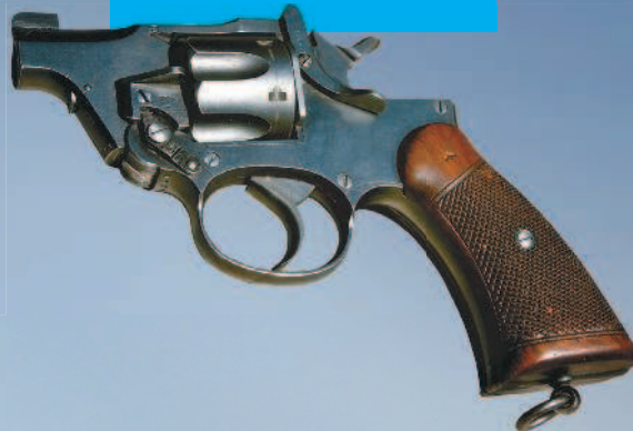
Короткоствольный револьвер для танкистов.

Ручной пулемет Льюиса устанавливался и в танках. Для охлаждения ствола этому пулемету в отличие от пулемета Максима не требовалась вода. В кожухе «Льюиса» были продольные ребра, из-за чего во время стрельбы создавалась тяга, холодный воздух засасывало внутрь кожуха и он охлаждал ствол.