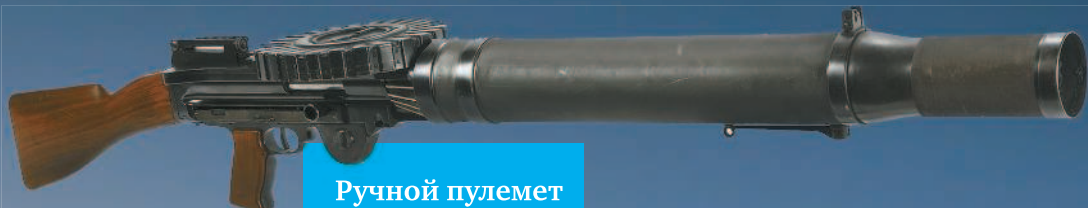
Ручной пулемет Льюиса.