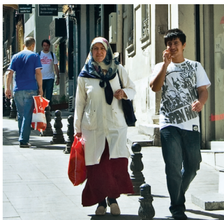
Люди на Истикляль

Население: более 16,4 млн чел. Ежегодное количество туристов: более 15 млн чел. (мировой рекорд после пандемии — 20,2 млн чел.) Длина подвесного моста через Босфор составляет 1560 метров Мечети: более 3365.