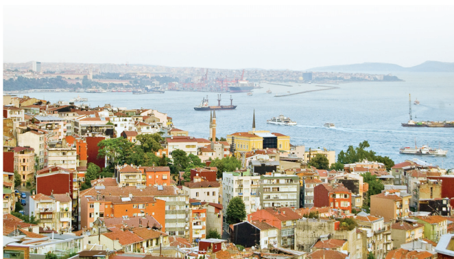
Стамбул с высоты птичьего полета

Если и есть один человек, оказавший самое значительное влияние на внешний вид современного Стамбула, то это, несомненно, Мимар Синан (1490–1588), который был главным придворным архитектором во времена правления Сулеймана Великолепного и расцвета Османской империи. К его наследию относятся бани Чемберлиташ, мечети Рустема-паши и Сулеймание.