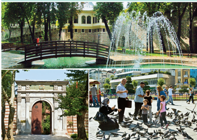
Голуби на площади Таксим