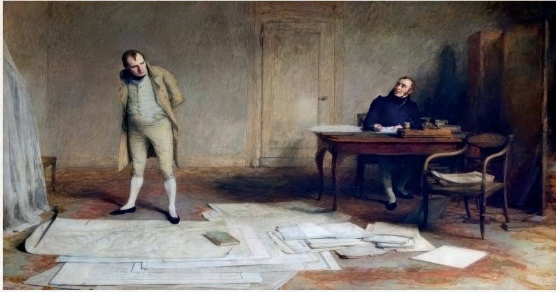
Уильям Орфордсон. Наполеон диктует мемуары Лас-Казу. 1892

ехала в Париж, где вышла замуж за виконта де Богарне, впоследствии генерала революции (и, конечно же, гильотинированного той же революцией). Креолку спасло только падение Робеспьера. Ну а далее, как известно, она стала женой генерала Бонапарта и, наконец, императрицей французов.