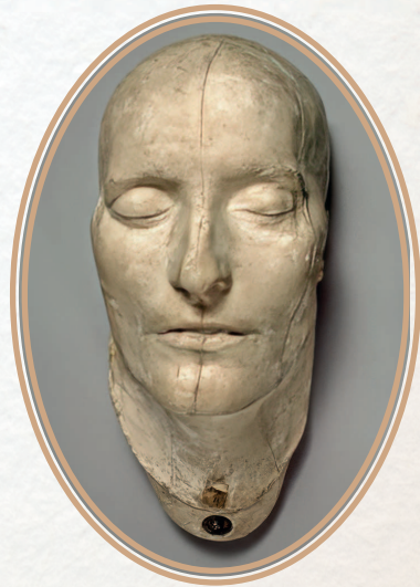
Посмертная маска Наполеона

Как я боялся вмешательства императора! У его постели всегда стояло заряженное ружье. Но из спальни