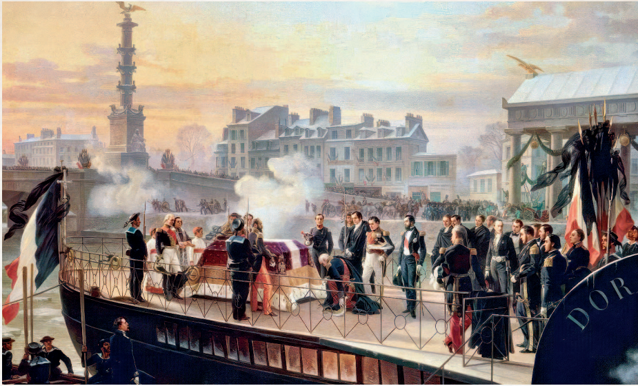
Феликс Фелиппото. Возвращение праха Наполеона I с острова Святой Елены. 14 декабря 1840 года. 1867

Но там его и похоронили. Там он и лежал почти двадцать лет и ждал, пока за ним приедут из Парижа. Ждал под безымянной плитой, которую охраняли английские солдаты.