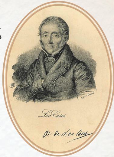
—♦—♦—♦— Портрет графа де Лас-Каз. Гравюра. Сер. XIX века

После революции я эмигрировал, был в армии принца Конде, сражавшейся против Республики. И только при императоре получил возможность вернуться во Францию. Тогда я и узнал обо всех событиях бурной жизни моей хорошей знакомой. Оказалось, она пере-