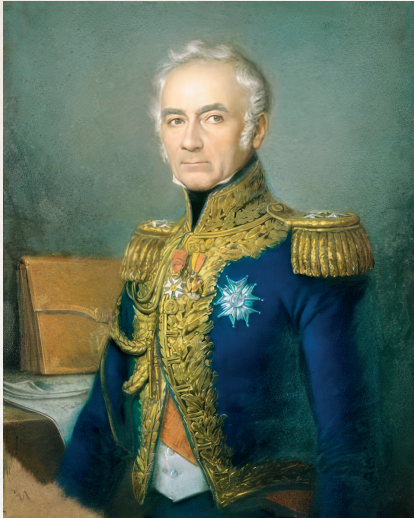
—♦♦♦— Эдуар Пингфе. Портрет генерала де Монтолона. XIX век

не донеслось ни звука. Неужели он не проснулся? Какое счастье!