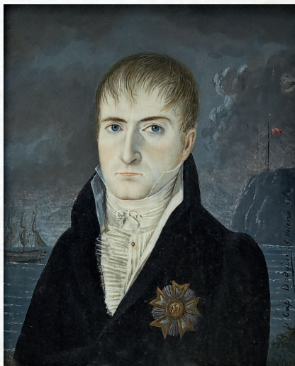
Неизвестный художник. Портрет Наполеона. 1820

Император занимает две комнатки по двенадцать метров с низенькими потолками. Здесь его кабинет и спальня.