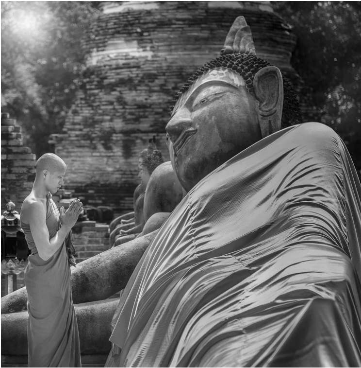
Буддийский монах внутри древнего храма Аюттахай. Таиланд

чески без остатка принял синтоизм — религию, почитающую местных богов и разнообразных духов, злых и добрых, от божеств ветра и солнца до мелких проказливых домовых. В Китае пришельцы из Индии «культурно обогатили» более древнюю местную религию — даосизм. То же самое случилось и в Тибете с религией бон. Конечно, последователи учения Будды верят в бодхисаттв, но это не боги, а живые люди,