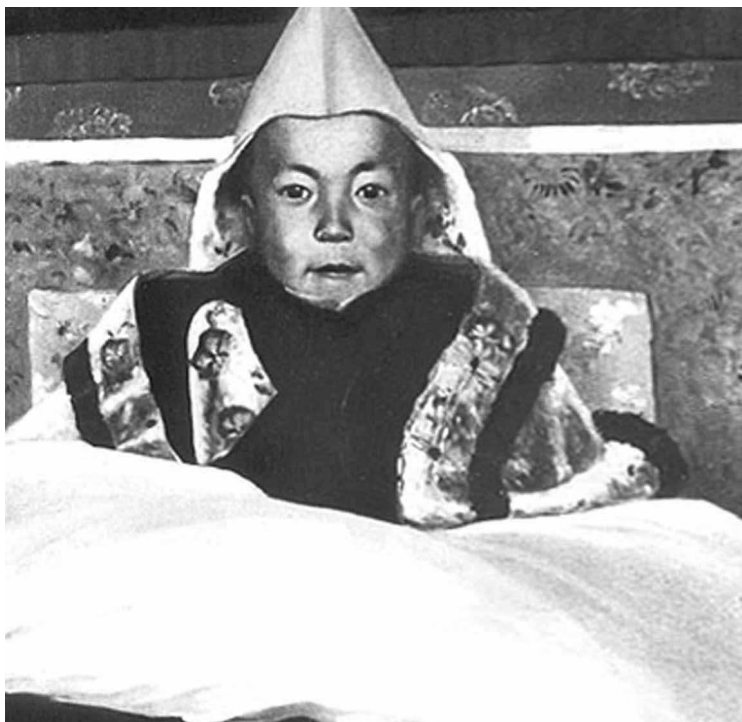
Юный Далай-лама XIV. 22 февраля 1940 г. Лхаса, Тибет

например, буддисты часто и охотно едят мясо, а в Японии, как мы уже упоминали, участвовали в кровопролитных войнах и убивали людей, даже руководили войсками (знаменитые князья-даймё «Эпохи воюющих провинций» Такеда Сингэн, Уэсуги Кэнсин и Сайто Досан обрили головы, то есть стали монахами). Почти все экзотические местные культы и религиозные традиции становились составной частью буддизма, причем некоторые настолько сами пропитались им, что