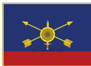
Флаг Ракетных войск стратегического назначения