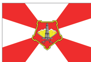
Флаг Центрального военного округа