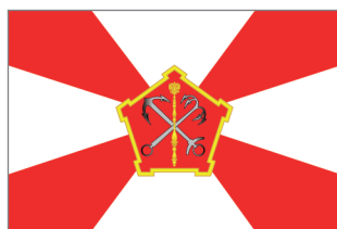
Флаг Западного военного округа