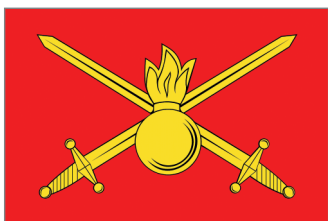
Флаг Сухопутных войск