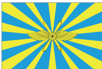
Флаг Воздушно-космических сил