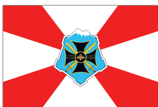
Флаг Южного военного округа