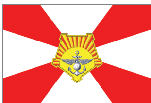
Флаг Восточного военного округа