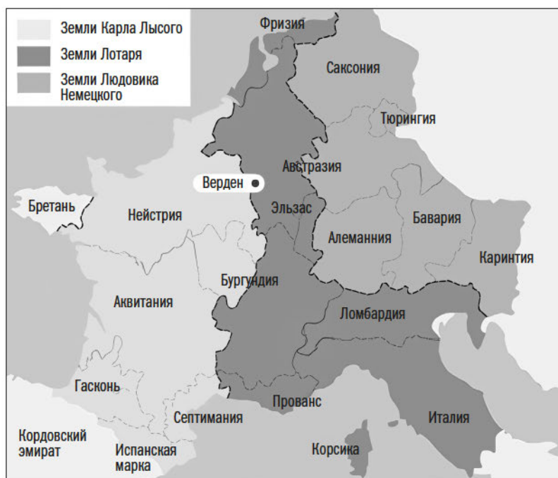
Верденский раздел империи Карла Великого в 843 году

такое случалось лишь несколько раз — и впервые — перед «прискорбной войной между сыновьями Людовика Благочестивого». Другими словами, монах-хронист XII века — возможно, не намеренно, но располагая преимуществом временной дистанции — отчетливо видел то, что Ангельберт мог только почувствовать: битва при Фонтенуа и гражданская война франков потоками крови смыли старый мир и создали новый. Европа более не была прежней.