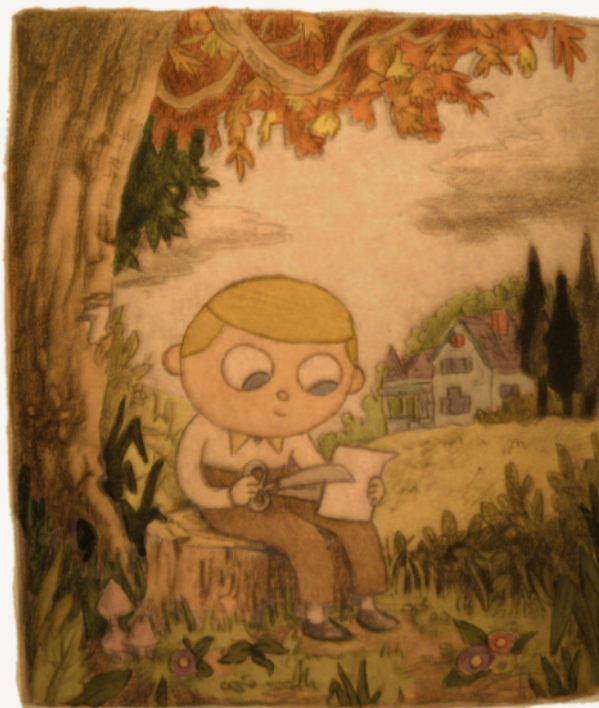
Портрет Уолтера из сборника идей 2006 года.

Презентация проекта в 2006 году также закрепила уникальное сочетание стилей, вдохновлённых Конкордом, которые использовались бы в пилотной серии и самом сериале. МакХэйл описал Междумирье как «место между жизнью и смертью, сном и реальностью. Смесь американского фольклора, классических сказок, историй про призраков и сновидений. Нескончаемый и постоянно меняющийся пейзаж, напоминающий одновременно и колониально-викторианскую Новую Англию, и немецкую глубинку».