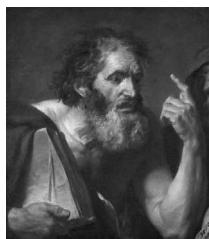
Жак-Луи Давид. Философ. 1779

Конечно, этими любопытными постулатами стоическая философия не исчерпывается. Мы предлагаем вам познакомиться с ней более подробно; причем объектом рассмотрения станут не только идеи философов-стоиков Древней Греции и Древнего Рима, но и современный стоицизм. А также его отражение в психологии, литературе и даже массовой культуре.