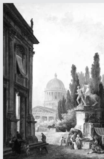
Юбер Робер. Виды Рима. 1780-е

Этим термином принято объединять эпоху цивилизаций Древней Греции и Древнего Рима