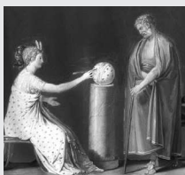
Антонио Канова. Урания, муза астрономии, рас- сказывает Фалесу о Вселенной. 1799

Самым известным представителем элейской школы философов (место ее рождения — греческая колония Элея, ныне это территория Италии) был Парменид. Он один из основоположников онтологии, учения о бытии, которое рассматривает основные формы бытия, пытается описать наиболее универсальные его принципы. Парменид заявлял, что все мыслимое есть Бытие, так как нельзя мыслить ни о чем. Небытия как такового не существует, ибо мы не можем представить его себе. Критерием истины мыслитель считал разум, не доверяя чувствам, ибо в них нет