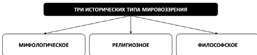
Рис. 1. Три исторических типа мировоззрения

Традиционно выделяются три исторических типа мировоззрения — мифологическое , религиозное и философское (рис. 1).