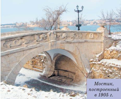
Мостик, построенный в 1905 г.

За памятником просматривается ажурная колоннада 6 Графской пристани. Первая пристань в Севастополе была построена почти сразу после основания города (1783 г.) по указанию командующего Черноморской эскадрой графа Войновича. И, хотя официально она называлась Екатерининской, народ упорно именовал ее Графской. Граф, видимо, был личностью неприязнительной, и обычный деревянный причал, без всяких архитектурных изысков, его устраивал. Знаменитая колоннада появилась только в 1846 г. В те годы военным губернатором Севастополя был адмирал Лазарев. Он и решил облагородить неказистую пристань. Проект был заказан военному инженеру Д. Утуну. В те времена любой архитектурный проект должен был представляться для утверждения на высочайшее имя. Сложно сказать, чем Николаю I не понравилась колоннада. Проект был утвержден без нее. Каких только ар-