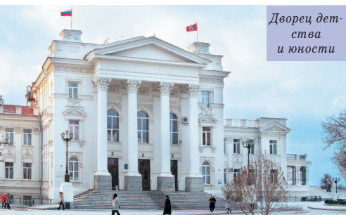
Дворец детства и юности

И, наконец, 9 памятник Затопленным кораблям – символ города. Когда к берегам Севастополя в 1854 г. подошла англо-французская эскадра, было решено затопить у входа в бухту несколько устаревших кораблей, чтобы предотвратить проникновение вражеского флота. Для моряков, привыкших относиться к кораблю, как к родному дому, это было тяжелым решением. «Грустно уничтожать свой труд, – говорилось в приказе адмирала Корнилова, – но надобно покориться необходимости». Позднее было затоплено еще несколько кораблей. И уже при отступлении российских войск был затоплен весь флот. Памятник построен в 1905 г. к 50-й годовщине первой обороны города, по проекту скульптора А.Г. Адамсона и архитектора В.А. Фельдмана. Его очертания просты и лаконичны. Оригинальна идея авторов установить монумент среди морских волн в нескольких метрах от берега. Напротив памятника укреплены два якоря с затопленных кораблей. С площадки перед памятником открывается панорама Севастопольской бухты. Привлекает внимание 40-метровый белый обелиск на мысу Хрустальный – стилизованное изображение штыка и паруса, символизирующее единство армии и флота. Он украсил мыс в 1977 г. За ним – памятник солдат и матросу. Его начали строить в начале 1980-х. Потом, вдруг, городские власти решили, что проект безвкусен, место выбрано неудачно и строительство было приостановлено. Несколько лет монумент так и стоял недостроенным. И только в 2000-х спохватились и доделали, торжественное открытие состоялось ко дню Победы в 2007 г.