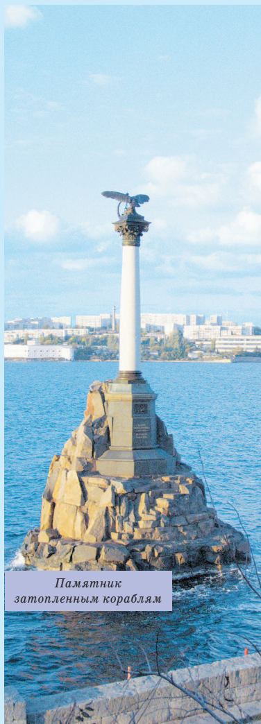
Памятник затопленным кораблям

С самого начала город делился на три части: Центральную часть, Корабельную сторону и Северную сторону. На Корабельной и Северной селился простой люд, отставные матросы с семьями, а центральная считалась аристократической. Но и здесь, сразу за домами почтенных граждан, начиналась безобразная