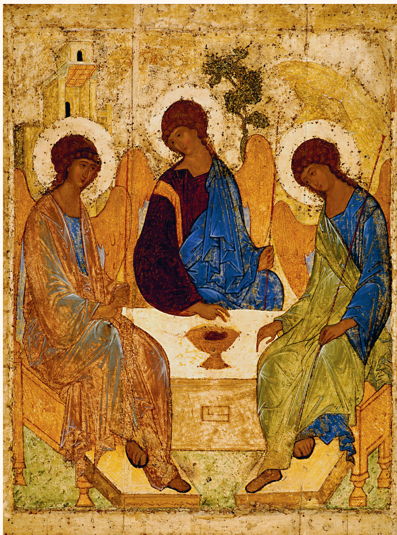
Икона Святой Троицы. Андрей Рублёв, XV в.